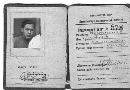
Рис. 7. Студенческий билет Ф.Х. Кутушева, 1944 г.

Fig. 6. F.H. Kutushev's certificate of demobilization, 1944