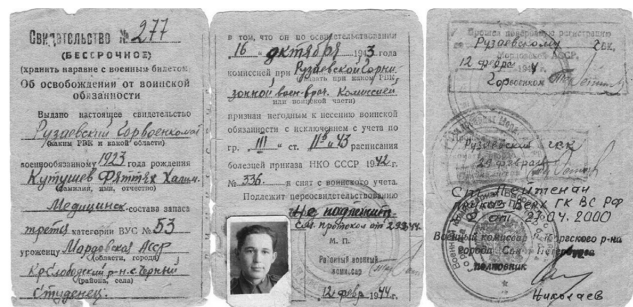
Рис. 6. Свидетельство Ф.Х. Кутушева о демобилизации, 1944 г.

Fig. 5. Student of the military medical school F.H. Kutushev, 1941