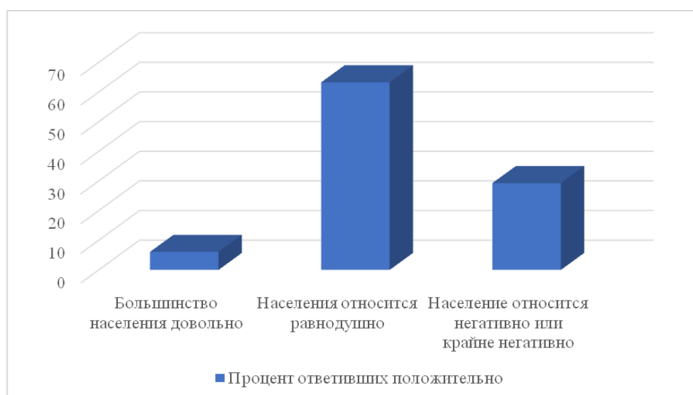
Рис. 2. Результаты опроса респондентов, вопрос «Отношение населения к территориальным преобразованиям муниципальных образований» (в % от общего числа опрошенных) [9].

Рассмотрим результаты опроса респондентов относительно влияния населения на данные процессы, и наоборот, – как отмечалось выше, эта проблема выделяется специалистами в качестве одной из основных. И проведенное исследование подтверждает данный тезис: так, лишь 6,1 % экспертов отмечает, что население позитивно относится к территориальным преобразованиям. Подавляющее большинство же либо оценивает их негативно, либо вовсе не обращает внимания на муниципальные реформы – по крайней мере, пока это не несет им напрямую существенного вреда (рис. 2).