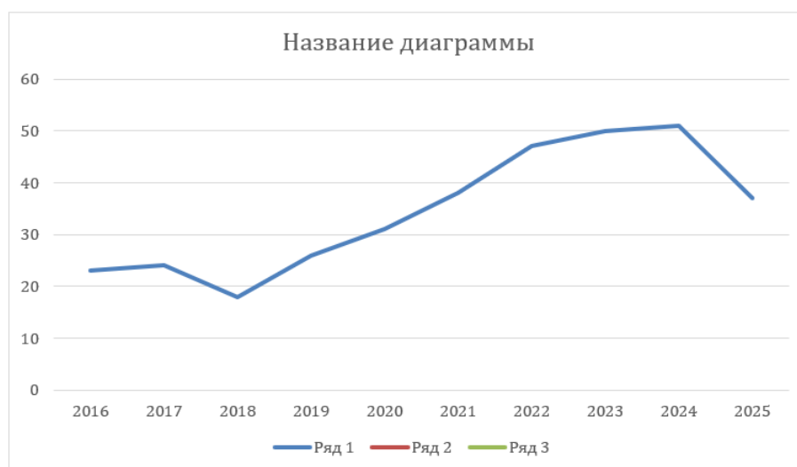
Рис. 4. Количество российских публикаций. Fig. 4. Number of Russian publications.

строномический дискурс важным объектом изучения в эпоху цифровых коммуникаций. Несмотря на некоторое снижение количества публикаций в 2025 г. (37 работ), тема сохраняет высокую научную активность. Цифра в 37 публикаций за 2025 год, скорее всего, отражает публикации за первое полугодие 2025 г.