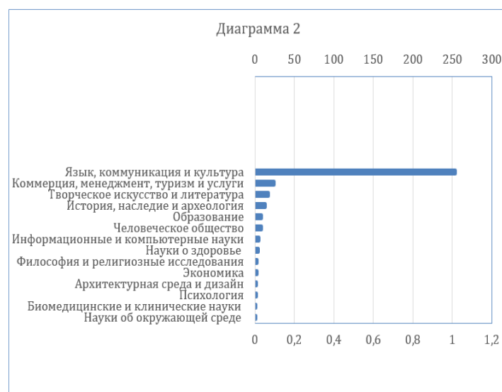
Рис. 2. Классификация: области исследования в российских изданиях. Fig. 2. Classification: areas of research in Russian publications.

диетологии, лечебного питания [28]; архитектурная среда и дизайн – исследование гастрономического пространства города [10]; биомедицинские и клинические науки [7] и науки об окружающей среде (экология) – гастрономия в экологическом дискурсе [32]. Распределение по областям представлено в рис. 2.