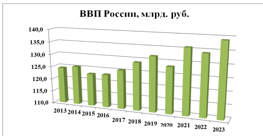
Рис. 1. Динамика ВВП России за период с 2013-2023 гг.