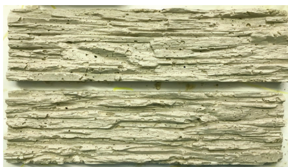
Рис. 1. Отделочный материал на основе гипсового вяжущего с добавлением древесных опилок

В современном строительстве все чаще применяют не чистый гипс, а материалы на его основе. Например, большое количество материалов, изготовленных на гипсовой основе, являются гипсобетонными. В качестве заполнителей нередко используют керамзит, кварцевый песок или шлаковую пемзу. Также они могут иметь в своем составе льняную кору, макулатуру и даже стебли камыша. Одним из таких отделочных ма-