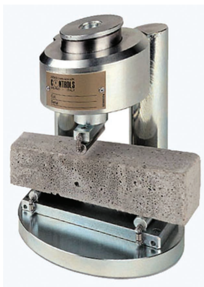
Рис. 2. Пресс

В проведенных экспериментах по определению предела прочности при изгибе был использован пресс (рис. 2). Образец располагался на опорах, удаление которых от центра прилагаемой нагрузки составляло 50 мм (возможная погрешность – 0,15 мм). Образец размещали таким образом, чтобы поверхность, на которую должен опираться образец, при изготовлении была вертикальной [1]. Нагрузку, прилагаемую к середине образца, увеличивали постепенно. Величина нагрузки изменялась со скоростью 50 Н/с. В момент