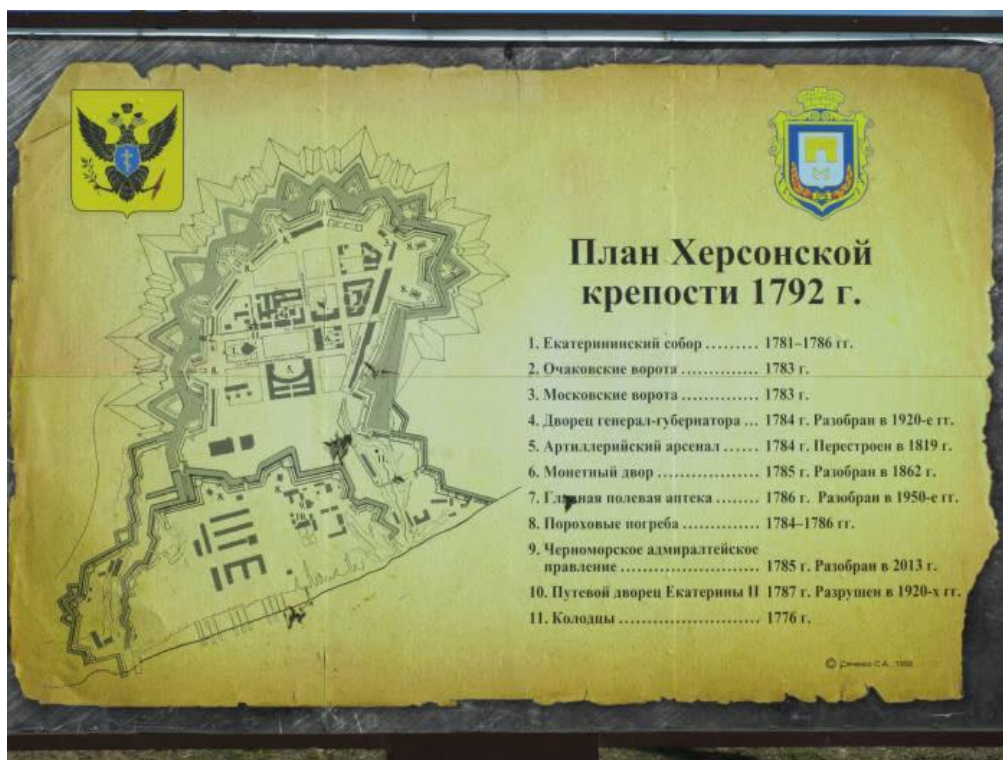
Рис. 1. План Херсонский крепости, 1792 г. Fig. 1. Plan of the Kherson fortress, 1792.

Для строительства города были привлечены именитые архитекторы и инженеры, такие как И. Ситников, И. Старов, Герма, К. Боржуа, М. Корсаков, и многие другие. В течение нескольких лет разработали регулярный план Херсона с четкими и ясными линиями. Центром стала Крепость (рис. 1), занимающая площадь порядка 100 га. Укрепление представляло собой целый комплекс, состоящий из культовых, общественных и военно-фортификационных сооружений. Оборонительная система крепости включала в себя бастионы, высокие земляные валы, подземные галереи, колодец, рвы, подъемные мосты на Очаковских и Московских воротах.