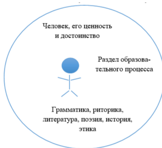
Рис. 2. Концепт понятия «гуманизм» в эпоху Возрождения. Fig. 2. The concept of “humanism” in the Renaissance.

Гуманизм объединяет ценностные принципы, признавая важность человека, его интеллектуальных и духовных потребностей, а также его способности к самореализации. Далее целесообразным будет рассмотрение процесса гуманизации как стремления к улучшению условий жизни человека, к развитию его потенциала и собственной личности. Понятие ценностей имеет ключевое значение, поскольку формирует основу для ценностных ориентаций человека, влияющих на его поведение и выбор в жизни. Ценностные отношения определяют взаимодействие между людьми на основе их ценностных установок. Гуманистические ценностные ориентации основываются на принципах гуманизма и выдвигают человека в центр внимания, признавая его достоинство и право на развитие. Гуманистическое мировоззрение является философским основанием для гуманистических ценностных ориентаций, определяющим отношение человека к миру, окружающим его людям и себе самому. Психолого-педагогическое образование направлено на формирование гуманистических ценностных ориентаций у обучающихся с учетом их индивидуальных потребностей и способностей, развития их личности и культуры мышления.