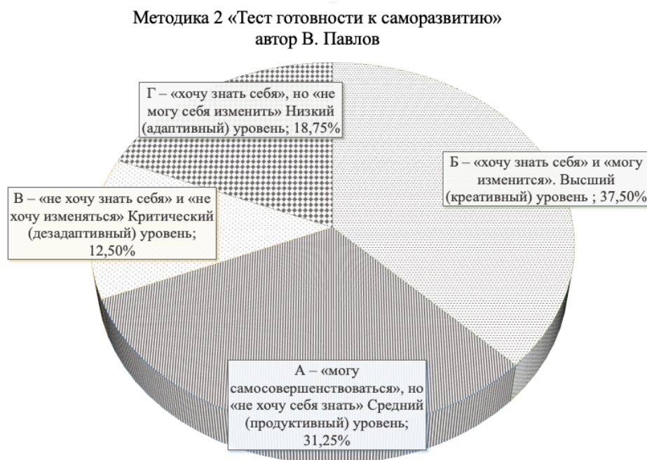
Рис. 2. Результаты диагностики когнитивно-самообразовательного компонента. Fig. 2. Results of diagnostics of the cognitive-self-educational component.

Важнейшим показателем успешного применения самоменеджмента является умение работать с информацией, представленной в различных форматах. Стиль работы, в ходе которого будущий педагог-управленец анализирует те или иные документы свидетельствует о вовлеченности в процесс, степени ответственности в выполнении рабочих задач, отражает преимущественное поведение в работе с документацией для каждого отдельного человека. Также, данный компонент самоменеджмента характеризует ценность и применение на практике умения управлять собственной образовательной и будущей профессиональной деятельностью, следование личному образовательному маршруту. У 56,25% опрошенных (низкий и критический уровень) эти процессы протекают стихийно, образование и профессиональная деятельность не регламентируется управленческими функциями (рис. 3).