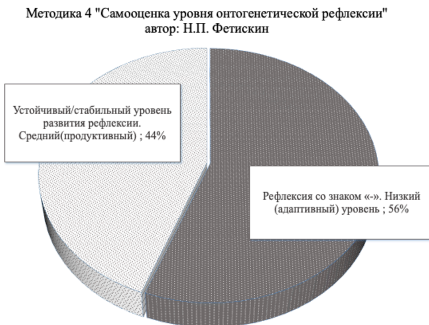
Рис. 4. Результаты диагностики рефлексивно-оценочного компонента.

Основными характеристиками данного уровня является понимание своего отношения к происходящим ситуациям, анализ и способность планировать будущие действия на основе прошлого опыта, но на данном уровне рефлексивные процессы могут иметь нерегулярный характер, а рефлексивный анализ проводится достаточно поверхностно.