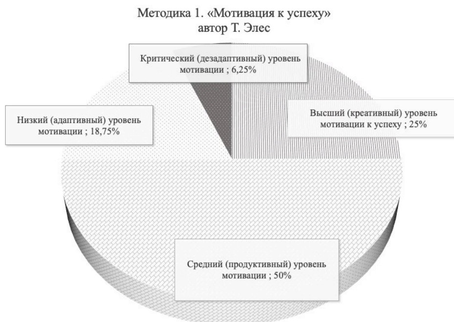
Рис. 1. Результаты диагностики мотивационно-ценностного компонента. Fig. 1. Results of diagnostics of the motivational-value component.

Анализ диагностики мотивационно-ценностного компонента самоменеджмента у магистранта (рис. 1) выявил у половины респондентов средний уровень мотивации, \frac{1}{4} опрошиваемых обладает высшим уровнем мотивации, в то время как у 19% был выявлен низкий уровень мотивации, а у 6,25% магистрантов и вовсе, оказался на критически низком уровне.