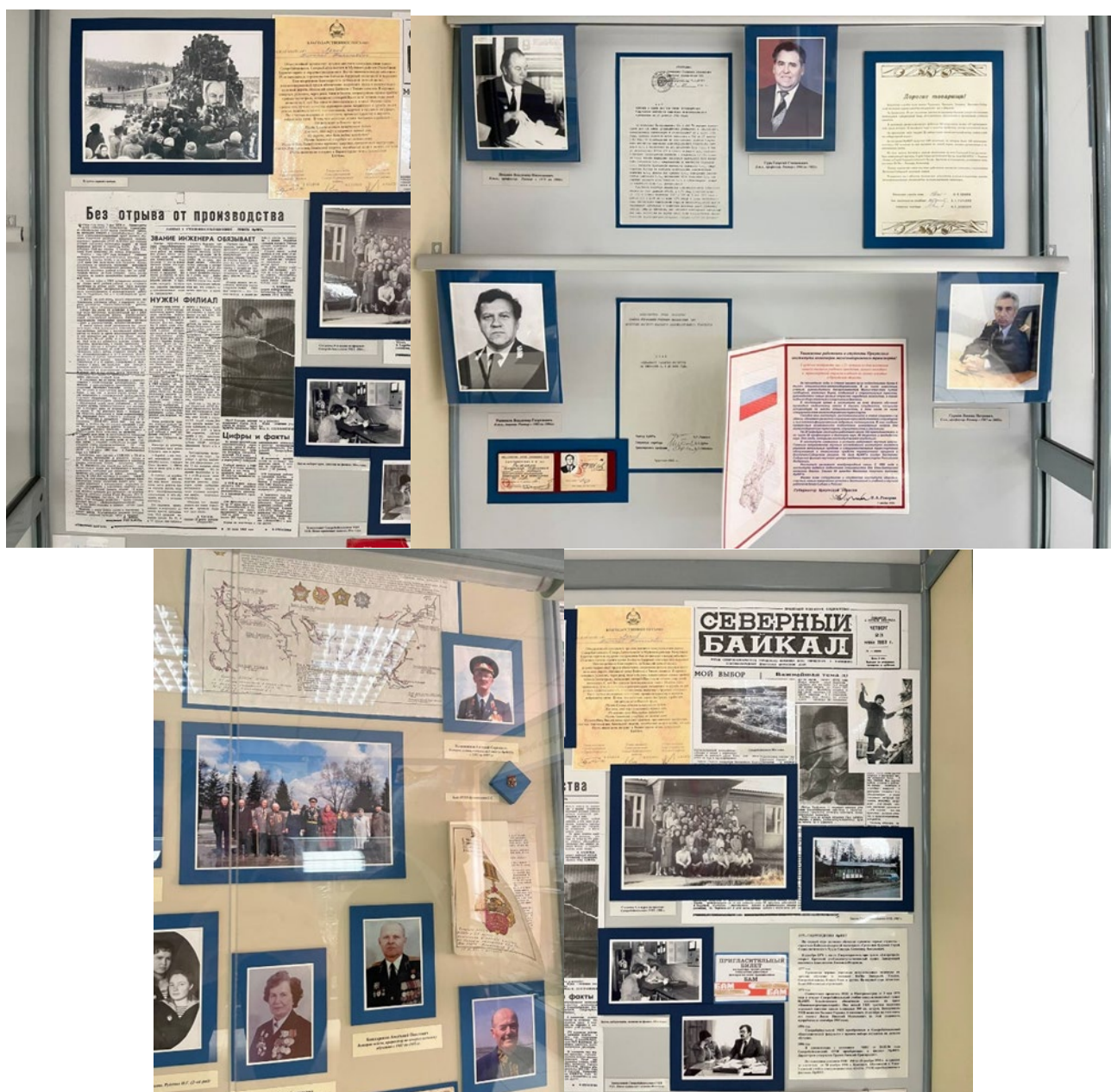
Рис. 1. Документы, связанные с основанием ИрГУПС.

Документы, связанные с основанием ИрГУПС, являются частью культурного наследия не только города Иркутска, но и всей России (рис. 1). Они сохраняют память о первых шагах университета, его основателях и первых студентах. Эти материалы могут быть использованы для создания выставок, публикаций и образовательных программ, направленных на популяризацию истории университета и его вклада в развитие транспортной отрасли.