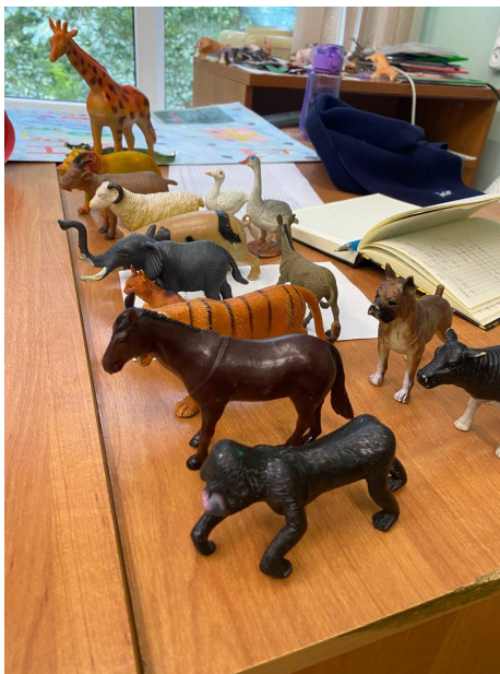
Рис. 5. Фигурки к игре “В зоопарке”. Fig. 5. Figures for the game “At the Zoo”.