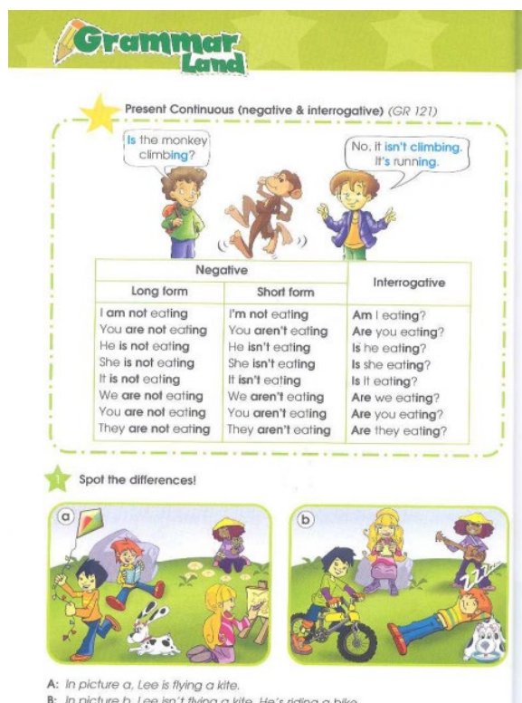
Рис. 7. Тема модуля 8. Fig. 7. Topic of module 8.