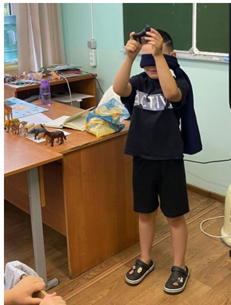
Рис. 6. Ученик угадывает животное. Fig. 6. The student guesses the animal.

Можно разделить на группы, выбрать в каждой группе из учеников по одному “сотруднику зоопарка”, который будет давать игрушку игроку с завязанными глазами. Учитель выступает в роли судьи. Побеждает та команда, которая угадала и назвала больше всего животных.