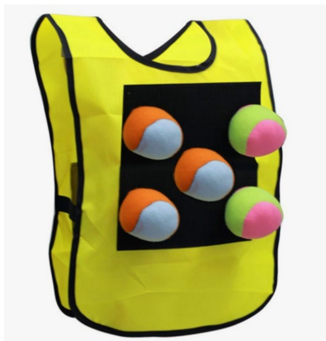
Рис. 10. Набор "Вышибалы липучками". Fig. 10. Set "Velcro bouncers".