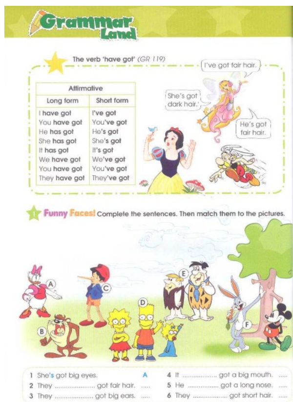
Рис. 9. Тема модуля "It's so cute". Fig. 9. The theme of the module is "It's so cute".