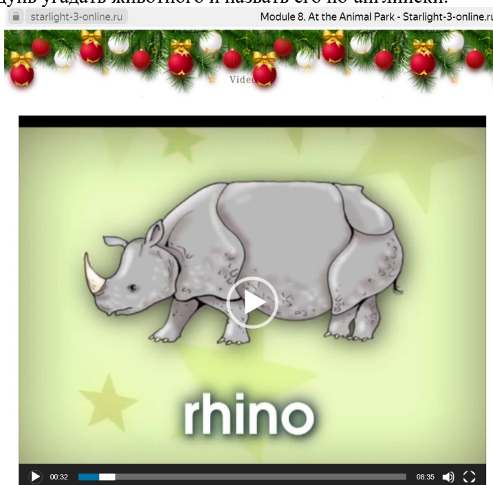
Рис. 4. Фрагмент видео к уроку. Fig. 4. Video fragment for the lesson.