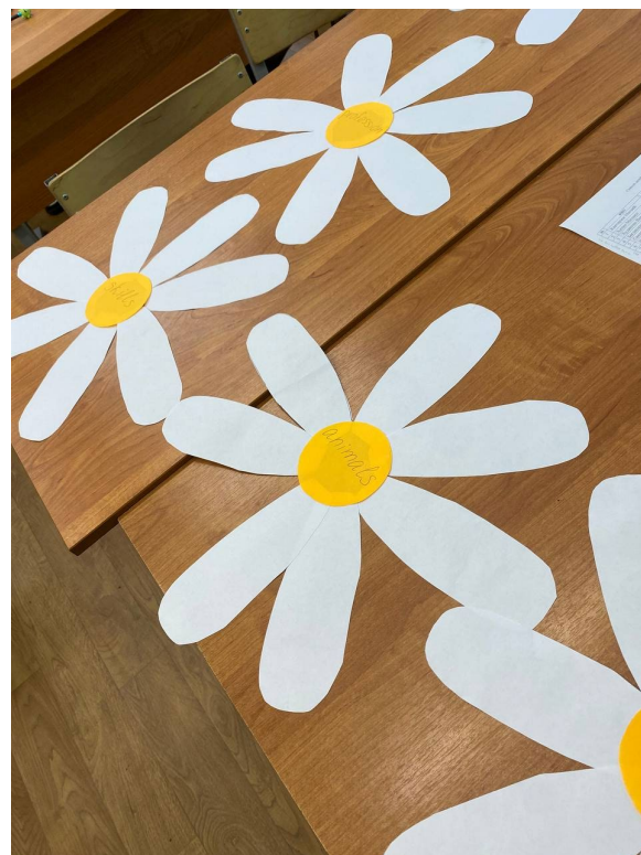
Рис. 8. Заготовки для игры "Ромашка". Fig. 8. Blanks for the game "Chamomile".