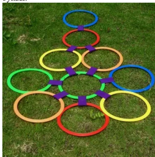
Рис. 2. Прыжковые круги. Fig. 2. Jumping circles.

Для повторения модуля “At the Animal Park” (предварительно он также изучался в школе) на занятии в лагере можно также взять дополнительное видео с упомянутой выше Интернет-платформы, а на прогулке провести игры на закрепление лексического материала по теме “Животные” (игра 3, игра 4) и на закрепление грамматического материала (игра 5).