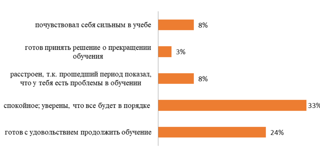
Рис. 1. Результаты анкетирования «Настроение респондентов на конец учебного года». Fig. 1. Results of the survey “Mood of respondents at the end of academic year.”

нует вопрос отсутствия жилья равно 14%. Для 11% обучающихся проблемы коммуникативного характера являются основными, а 7% считают, что обеспечение учебной литературой недостаточно обширное. И лишь 4% выделяют отсутствие информации в вузе о формах общественной жизни.