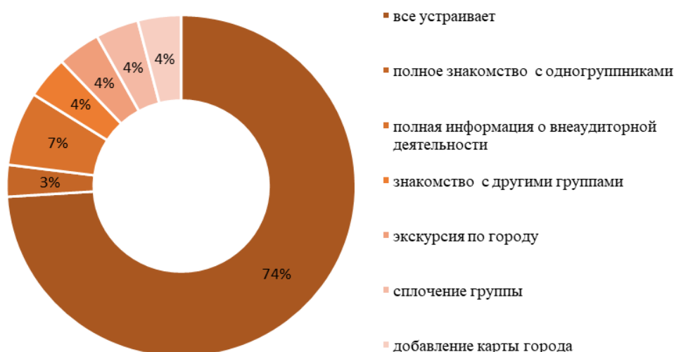
Рис. 2. Ответы респондентов о добавлении/ изменении адаптационных мероприятий для первокурсников. Fig. 2. “Respondents' responses on adding/changing adaptation measures for first-year students.”

Представлены ответы респондентов о добавлении / изменении адаптационных мероприятий для первокурсников (рис. 2).