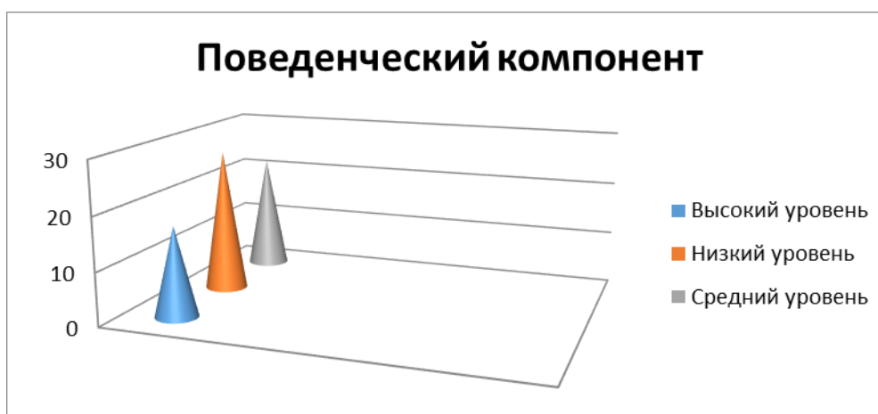
Рис. 2. Результаты диагностики поведенческого компонента EQ.

Следующая диагностика была направлена на изучение поведенческого компонента (рис. 2). Высокого уровня достигли 17 школьников – 22,97%. Средний был выявлен у 27 диагностируемых – 47,3%. Низкий же показали сразу 22 ребенка, что составляет 29,73%.