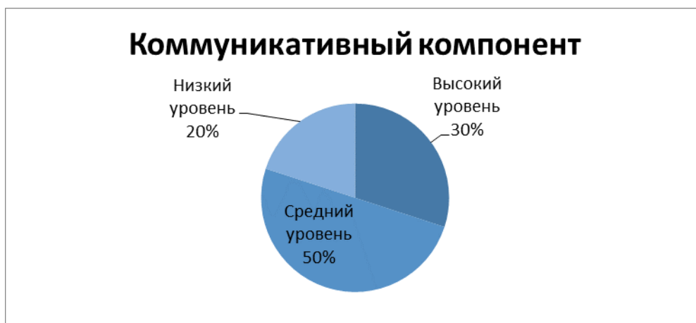
Рис. 1. Результаты диагностики коммуникативного компонента социального воспитания.

Первым компонентом диагностики стал коммуникативный. Высокий уровень продемонстрирован 22 школьниками, что составляет 30 %, среднего уровня достигли 36 детей – 50%, на низком уровне находится 14 учащихся – 20% (рис. 1).