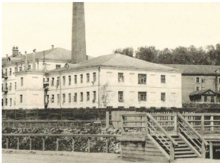
Рисунок 3. Фабрика Котовых. Фото начала XX века.

Уже были переобустроены фабричные корпуса (рис. 3), открыто общежитие для персонала, проведены вентиляция, водопровод и даже центральное отопление, что позволило Н. Н. Баженову с гордостью писать, что теперь «Преображенская больница располагает таким помещением для прислуги, которым могут похвастаться редкие русские, да и далеко не все западноевропейские больничные учреждения» [10].