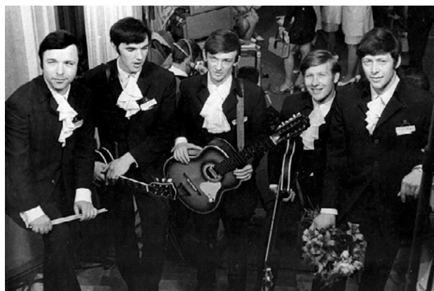
ВИА «Камертон», 1970