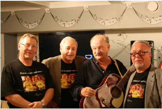
ВИА «Камертон», 2015. Презентация альбома «Никто не похитил нашу юность»