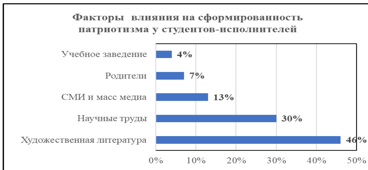
Рис. 2. Факторы влияния на формирование патриотизма у студентов-исполнителей Студенческой филармонии РГПУ им. А.И. Герцена.

Fig. 2. Factors influencing the formation of patriotism among student performers of the Student Philharmonic of the Herzen State Pedagogical University.