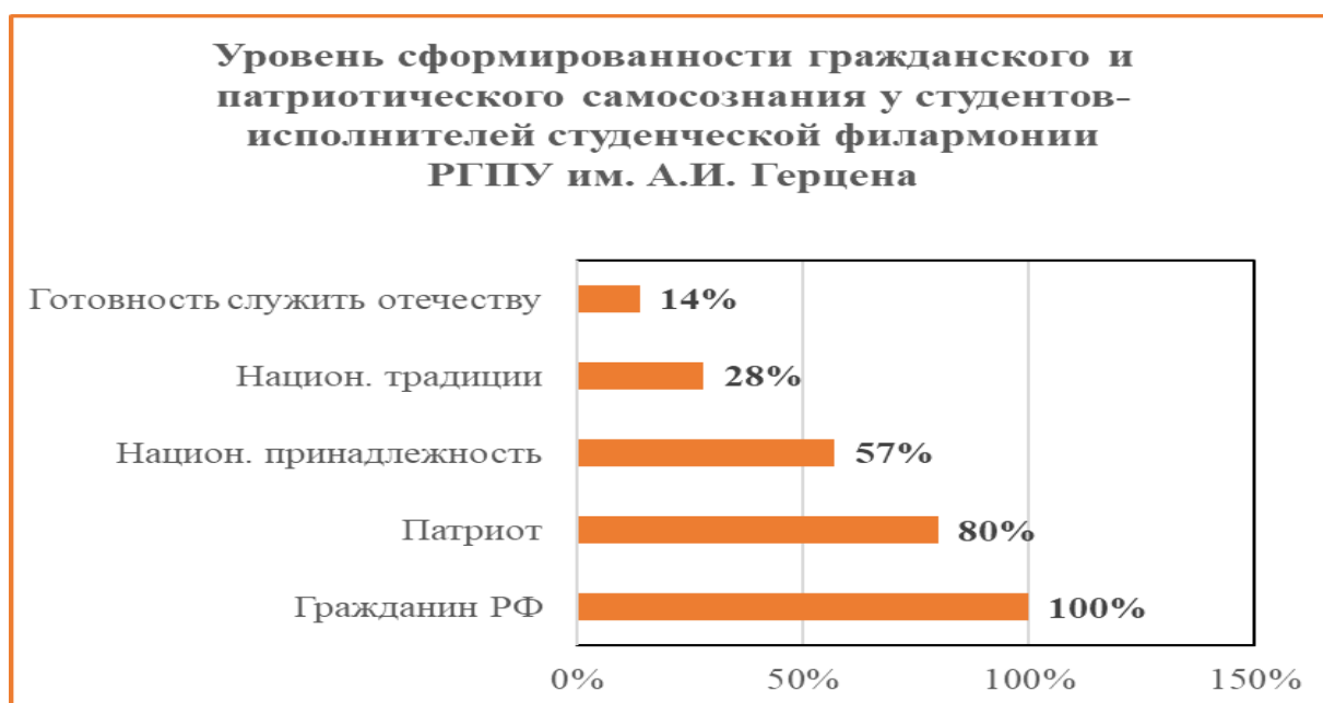
Рис. 1. Уровень сформированности гражданского и патриотического самосознания у студентов-исполнителей Студенческой филармонии РГПУ им. А.И. Герцена.

Опираясь на ответы студентов-исполнителей, можно констатировать, что гражданином России считают себя 100% и 80% - патриотами, так же определяют свое отношение к нации, национальным традициям и к долгу перед Отечеством. Кроме того, 20% считают, что не стоит уделять внимания патриотическому воспитанию молодежи больше, чем сейчас. Однако 57% гордятся принадлежностью к своей нации, 28% верны ее культуре и традициям, 14% готовы к служению Отечеству и самопожертвованию как проиллюстрировано на рисунке 1.