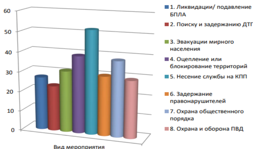
Рис. 1. Распределение видов мероприятий сотрудников СОП. Fig. 1. Distribution of types of activities of SOP employees.

Как мы можем видеть на графике, основным видом профессиональной деятельности сотрудников СОП в период командировки, являлось несение службы на контрольно-пропускных пунктах в районах граничащих с зоной проведения СВО. Помимо этого, значительное количество сотрудников СОП привлекались к мероприятиям по охране общественного порядка, оцеплению (блокированию) участков местности, проведению эвакуации населения в безопасные районы. Половина сотрудников 50 % (n=29) принявшая участие в анкетировании указали, что за время командировки, участвовали в силовых мероприятиях по задержанию правонарушителей. 38 % (n=22) сотрудников принимали участие в мероприятиях по розыску и задержанию диверсионно-террористических групп ВСУ.