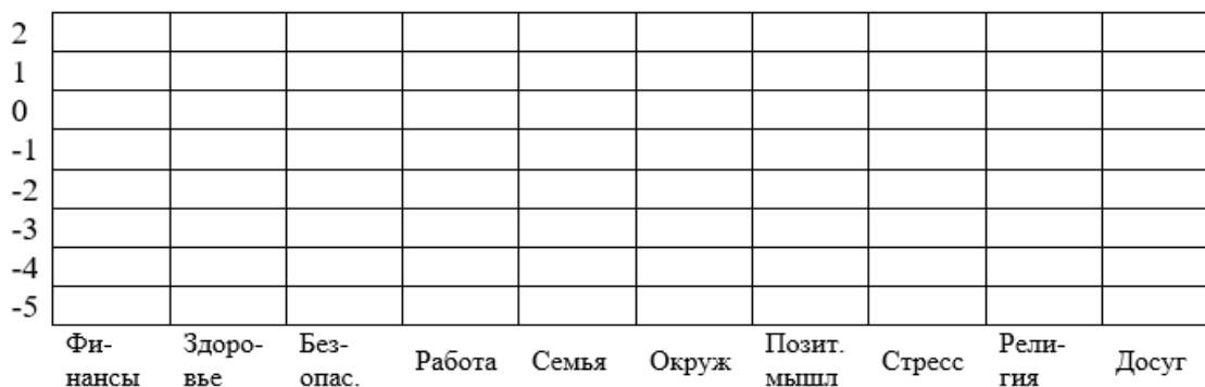
Рис. 2. Индивидуальный профиль дисбаланса. Fig. 2. Individual imbalance profile.

4. Индивидуальный профиль дисбаланса (рис. 2) рассчитывается разница (В – У) по каждому фактору. Большие положительные значения указывают на зоны выраженного несоответствия (важно, но не удовлетворен).