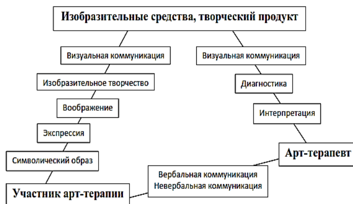
Рис. 2. Арт-терапевтическая модель психологического воздействия. Fig. 2. Art therapy model of psychological influence.

Процесс арт-терапевтического взаимодействия можно представить в виде структурно-функциональной модели (рис. 2).