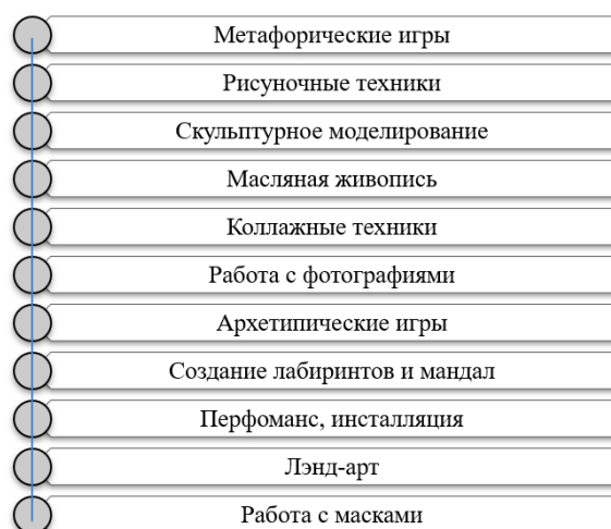
Рис. 3. Традиционные формы работы с арт-объектами. Fig. 3. Traditional forms of working with art objects.

Наиболее распространенными методиками арт-терапевтической работы являются: рисунок, коллаж, сказка, мандала, маска, скульптура, библиотерапия, мульттерапия, музыкотерапия, песочная терапевтическая практика. Каждая из методик имеет четкие инструкции, предписания и возрастные ограничения. Наиболее встречающиеся формы индивидуальной и групповой работы в арт-терапии представим в рис. 3.