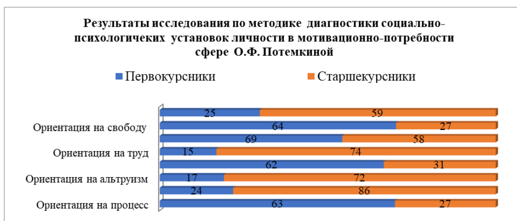
Рис. 1. Результаты исследования по методике диагностики социально-психологических установок личности в мотивационно-потребностной сфере О.Ф. Потемкиной.

Не показали статистических различий данные по шкале «Направленность на общение», что дает возможность предположить, что указанная ориентация является ценной для тех, кто выбрал для себя профессию «учитель». У двух групп респондентов эти показатели имеют среднее значение.