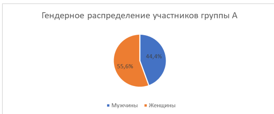
Рис. 2. Распределение группы специалистов социэкономического профиля с профессионально-направленными жизненными планами в зависимости от гендерной принадлежности.

На рис. 2 и 3 представлено распределение участников группы А (с профессиональной направленностью жизненного плана) в зависимости от социодемографических данных.