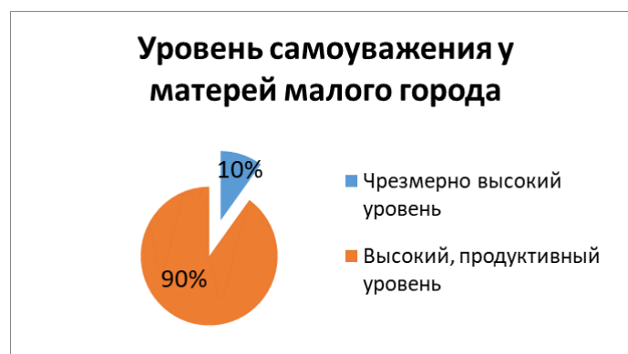
Рис. 4. Уровень самооужения у матерей из малого города. Fig. 4. Level of self-esteem among mothers from a small town.

в) женщин с низким или средним уровнем самооужения не обнаружено.