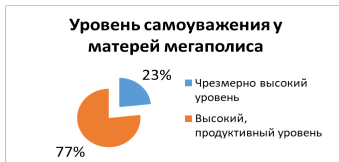
Рис. 3. Уровень самооужения у матерей из мегаполиса. Fig. 3. Level of self-esteem among mothers from a metropolis.

а) людей с чрезмерно высоким уровнем самооужения (те, кто набрал от 35 до 40 баллов) – 23% от выборки; это женщины, которые уважают себя как человека, личность и профессионала; они способны развиваться и совершенствоваться в различных сферах своей жизни;