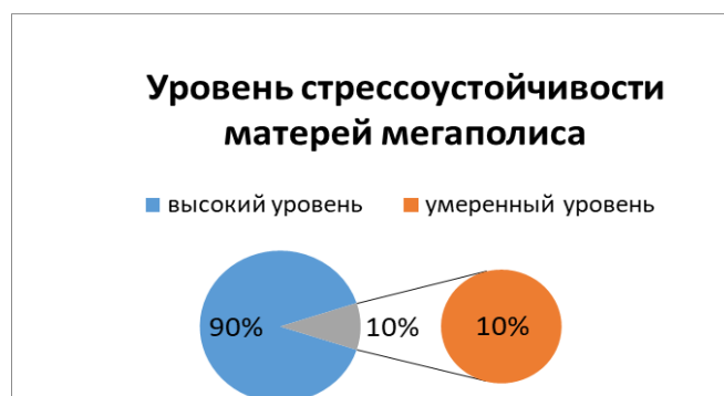
Рис. 1. Уровень стрессоустойчивости у матерей из мегаполиса. Fig. 1. Level of stress resistance in mothers from a metropolis.

б) умеренный уровень регуляции стресса (те, кто набрал от 5 до 7 баллов) имеют 10% женщин: они, как правило, сохраняют самообладание, но могут «выходить из себя» и не всегда правильно вести себя в ситуациях стресса; даже незначительные события могут нарушить их эмоциональное равновесие.