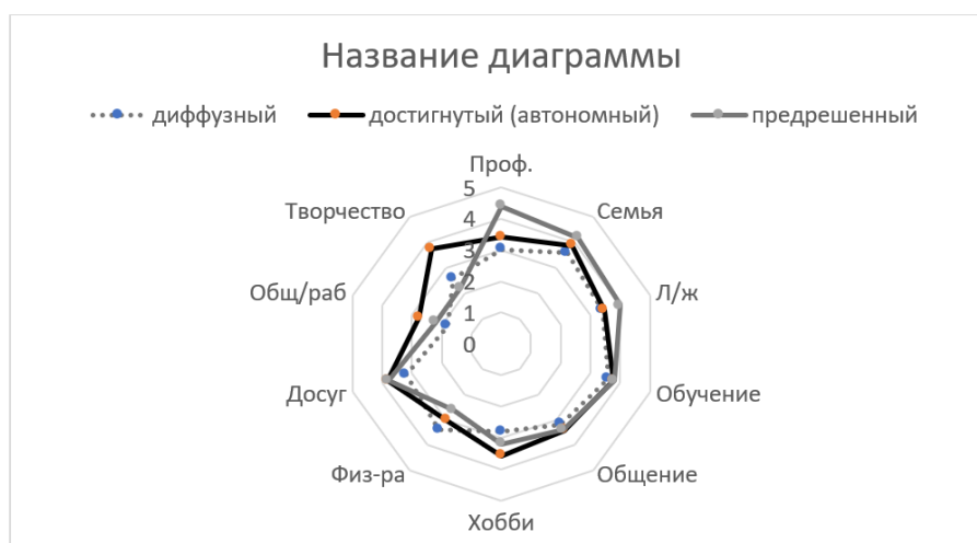
Рис. 2. Ценность сфер жизни, в зависимости от статуса эго-идентичности (средние показатели).

времени тратят на творческие виды деятельности, общественную работу и досуг; испытуемые с предрешенным статусом эго-идентичности - больше времени тратят на профессиональную сферу жизни, семейную и сферу личной жизни; тогда как респонденты с диффузным статусом эго-идентичности- показали наименьшую активность в большинстве сфер жизни. Единственная сфера, которой они уделяют больше внимания, это – физкультура (фитнес).