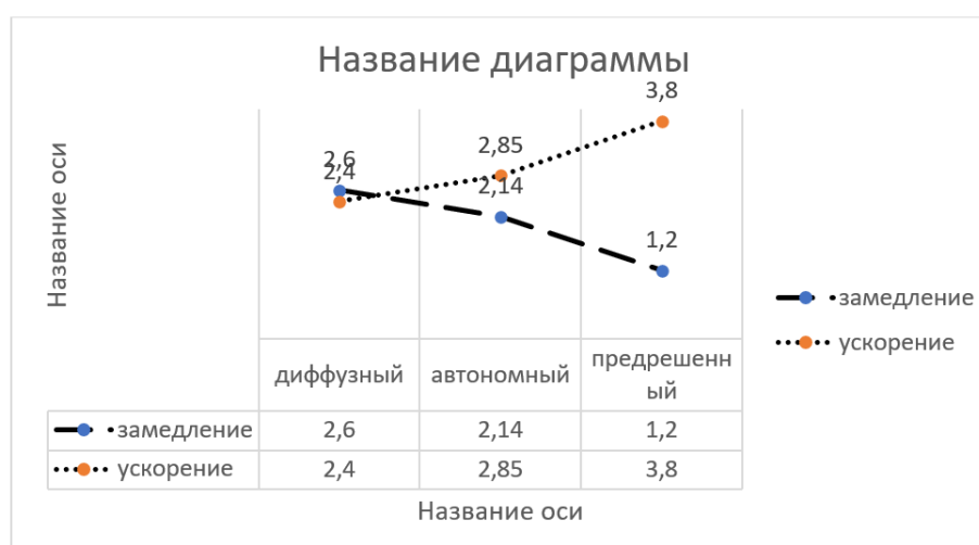
Рис. 3. Субъективное восприятие скорости течения времени, в зависимости от статуса эго-идентичности (средние показатели).

На рис. 3 показаны различия между респондентами с разными статусами эго-идентичности в субъективном восприятии скорости течения времени жизни.