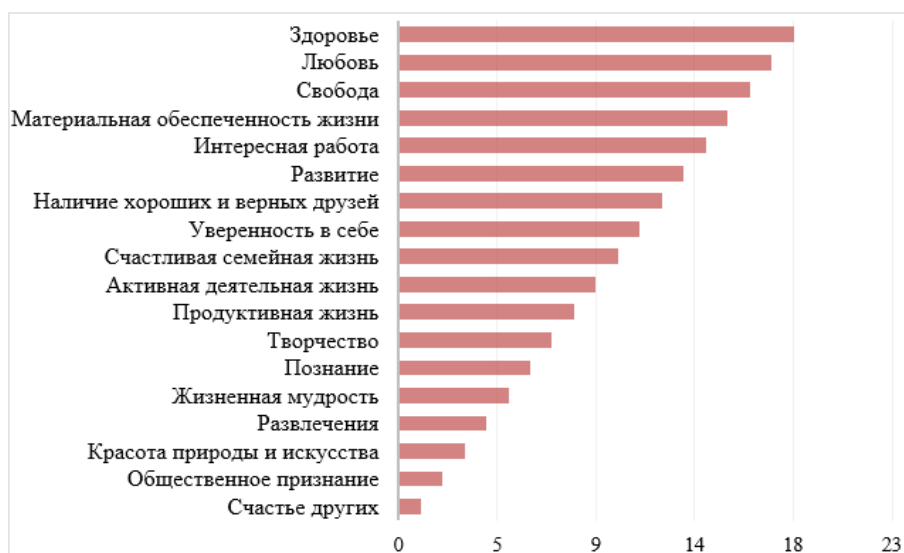
Рис. 2. Ранговое распределение терминальных ценностей у юношей и девушек.

остается на первом месте (рис. 2). Самыми значимыми ценностями-целями юноши определили: «любовь», «свободу», «материальную обеспеченность жизни» и «интересную работу».