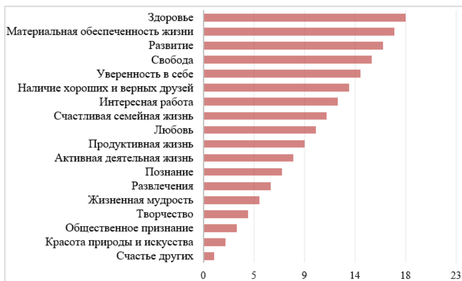
Рис. 1. Ранговое распределение терминальных ценностей у подростков.

Для удобства восприятия результатов исследования ценностных ориентаций были построены диаграммы (рис. 1-4), в которых данные представлены зеркально.