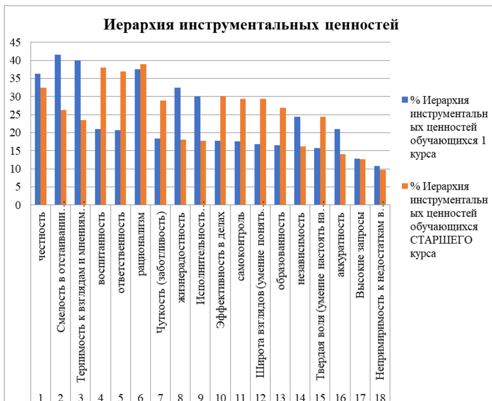
Рис. 2. Иерархия инструментальных ценностей по методике М. Рокича «Ценностные ориентации». Fig. 2. Hierarchy of instrumental values according to M. Rokeach's method "Value orientations".