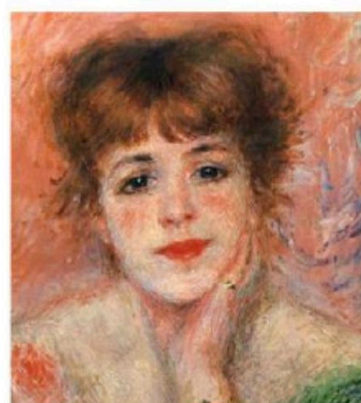
Рис. 2. Примеры картин для эксперимента.