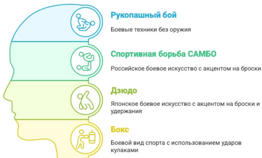
Рис. 1. Виды спортивных единоборств, которые популяризируются в системе МВД России.

Таким образом, образовательные организации МВД России внедрились в учебный процесс спортивные единоборства, которые активно развиваются и становятся популярными как в стране, так и за ее пределами. Самыми популярными видами единоборств, которые популяризируются в системе МВД России, являются виды, отраженные в рис. 1.