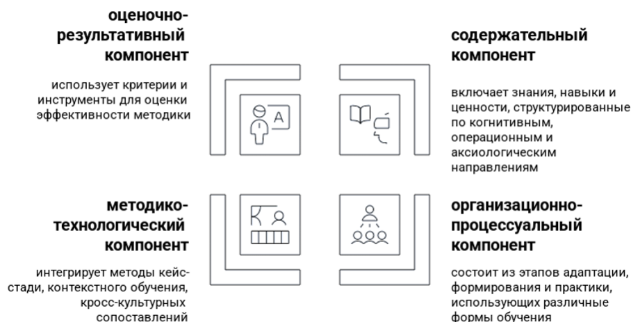
Рис. 1. Методика формирования учебной культуры у иностранных студентов, изучающих русский язык как иностранный, на подготовительном факультете вуза.

Данные методы составили методико-технологическую часть разработанной методики формирования учебной культуры у иностранных студентов, изучающих русский язык как иностранный, на подготовительном факультете вуза. Схематически разработанная методика представлена на рис. 1.