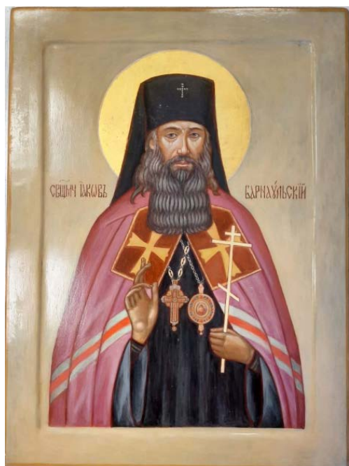
Рис. 12. Свщ. Иаков Барнаульский (30×40, липа, левкасный грунт, стёртая на яйце темпера, золото, копаловый лак с воском). Авт. Т. Родионова