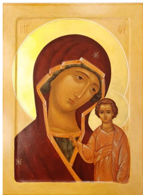
Рис. 11. Богородица Казанская (30×40, липа, левкасный грунт, стёртая на яйце темпера, золото). Авт. С. Симачевская