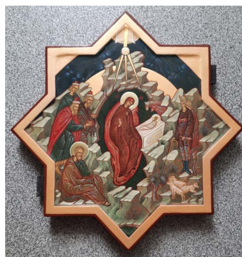
Рис. 18. Рождество Христово (37×37, липа, левкасный грунт, стёртая на яйце темпера, золото, копаловый лак с воском). Авт. М. Никольский

Итак, мы можем сказать, что подобное стремление к воссозданию иконописного образа проникнуто не просто историческими событиями, но и духовным, молитвенным опытом предшествующих поколений. «Задача состоит не в том, чтобы вызвать в нём то или иное естественное человеческое переживание, а в том, чтобы направить на путь преобразования всякое чувство, так же как и разум, и все другие свойства человеческой природы» [10] (рис. 18).