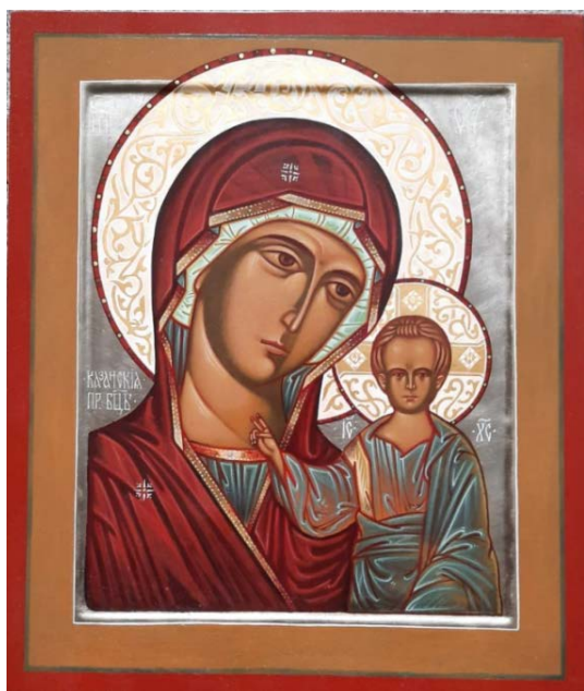
Рис. 6. Богородица Казанская (30×40, липа, левкасный грунт, стёртая на яйце темпера, золото, копаловый лак с воском). Авт. М. Никольский

Жёлтая краска заменяется колером из белил и охра золотистой (рис. 7). «Данный цвет наиболее близок к золотому и часто используется как его замена, но его особый смысл – обозначение высшей власти ангелов» [3].