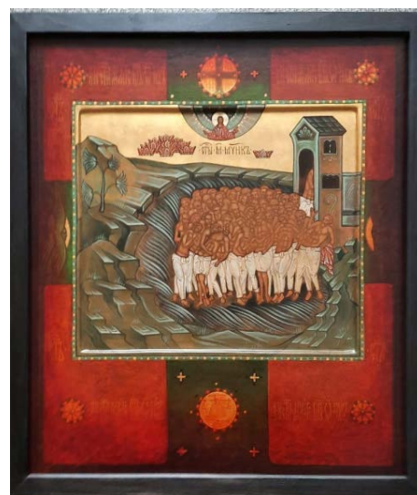
Рис. 17. Сорок мучеников Севастийских (38×38, липа, левкасный грунт, стёртая на яйце темпера, золото, копаловый лак с воском). Авт. М. Никольский

Тамбовское иконописное направление, продолжая традиции уставной православной иконописи, применяет все вышеперечисленные виды орнамента. Но необходимо указать, что орнамент, несмотря на свою уникальность и некоторую символическую нагрузку, вторичен по своему содержанию по отношению к семиотическому аспекту в иконе (рис. 17).