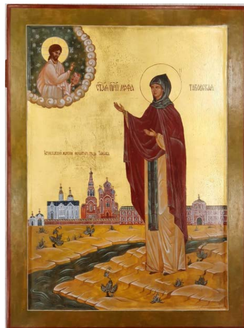
Рис. 15. Св. Прп. Марфа Тамбовская (30×40, липа, левкасный грунт, стёртая на яйце темпера, золото, копаловый лак с воском). Авт. О. Пачина