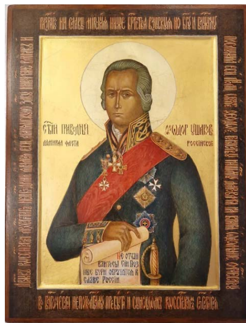
Рис. 13. Св. воин Федор Ушаков (30×40, липа, левкасный грунт, стёртая на яйце темпера, золото, копаловый лак с воском). Авт. С. Симачевская