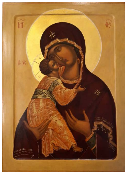
Рис. 10. Богородица Владимирская (30×40, липа, левкасный грунт, стёртая на яйце темпера, золото, копаловый лак с воском). Авт. С. Симачевская

При этом часто используются композиции Святых, связанных с Тамбовским краем. Это: Силуан Афонский, Питирим Тамбовский, Марфа Тамбовская, Амвросий Оптинский, Серафим Саровский и т. д. (рис. 16).