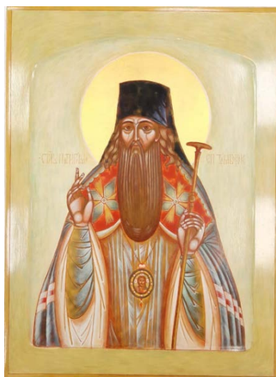
Рис. 16. Святитель Питирим Тамбовский (30×40, липа, левкасный грунт, стертая на яйце темпера, золото, копаловый лак с воском). Авт. И. Великанов

Активно используется орнамент. Орнамент (от лат. ornamentum ) – украшение – узор, состоящий из ритмически упорядоченных элементов и предназначенный для украшения различных предметов (утвари, оружия, мебели, одежды и т. д.), архитектурных сооружений, предметов декоративно-прикладного искусства» [9, с. 136]. Существуют следующие виды орнаментов: символический, геометрический, технический, растительный, каллиграфический, пейзажный, животный, предметный, фантастический, астральный [9]. Непосредственно в иконописи используются далеко не все виды. Применяется геометрический, символический, растительный, каллиграфический, животный (некоторые элементы).