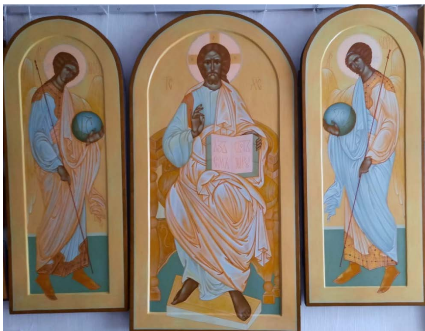
Рис. 19. Триптих. Иисус Христос с предстоящими (75×140, липа, левкасный грунт, стёртая на яйце темпера, золото, копаловый лак с воском). Авт. М. Никольский

Проблемы современного иконописания обсуждаются на ежегодной международной конференции «Поленовские чтения», где есть отдельная секция иконописи.