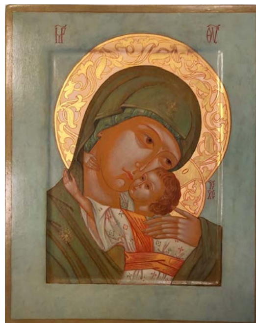
Рис. 4. Богородица Игоревская (17×22, липа, левкасный грунт, стёртая на яйце темпера, золото, копаловый лак с воском). Авт. О. Пачина

Тамбовские иконописцы не используют синюю и жёлтую краски в истинном варианте. Тем не менее, синий символический цвет, символ Богоматери, получается путём смешивания малахита и чёрного.