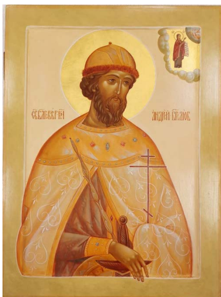
Рис. 7. Св. Блгв. кн. Андрей Боголюбский (30×40, липа, левкасный грунт, стёртая на яйце темпера, золото, копаловый лак с воском). Авт. С. Симачевская

Жёлтая краска заменяется колером из белил и охра золотистой (рис. 7). «Данный цвет наиболее близок к золотому и часто используется как его замена, но его особый смысл – обозначение высшей власти ангелов» [3].