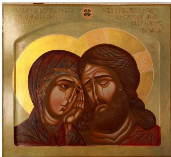
Рис. 8. «Не рыдай «Мне Мати» (30×40, липа, левкасный грунт, стёртая на яйце темпера, золото, копаловый лак с воском). Авт. И. Великанов

Прослеживается тенденция уменьшения чистых, золотых пятен. Фоновое пространство тамбовские иконописцы стараются передать через сложные цветовые оттенки салатово-песочных тонов, то есть иконе придаётся более аскетичный, тонкий колорит.