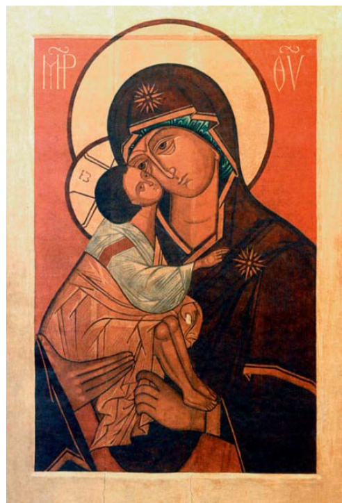
Рис. 2. Икона Донской Богоматери

Одной из известнейших его работ является икона Донской Божией Матери, установленная в Измалковской часовне (рис. 2). В 20-х гг. XX века часовня была разрушена и только в 1970-х гг. чудом нашлась икона в сарае деревенского дома. Стараниями дочери иконописца икона была увезена в Москву, отреставрирована и помещена в Покровский храм Свято-Данилова монастыря и признана выдающимся произведением иконописи XX века.