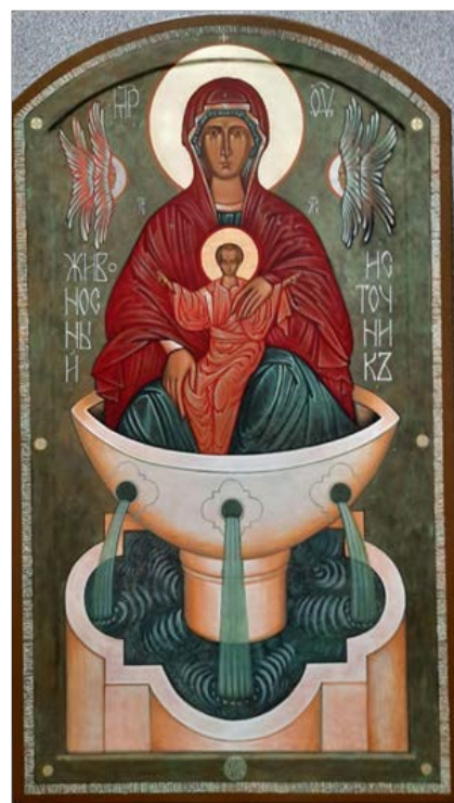
Рис. 5. Богородица Живоносный источник (70×115, липа, левкасный грунт, стёртая на яйце темпера, золото, копаловый лак с воском). Авт. М. Никольский