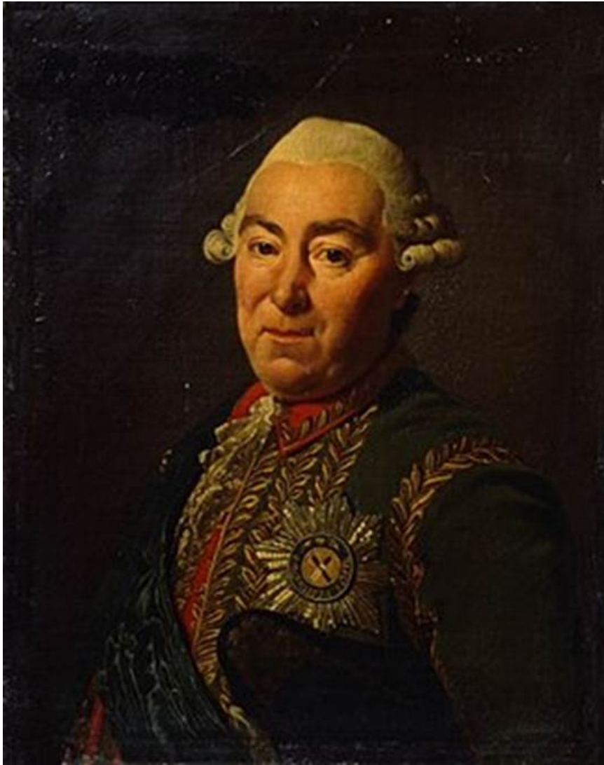
Рис. 5. Портрет А. М. Голицына. Копия П. Шембарева с оригинала кисти А. Рослена середины XVIII в. Конец XVIII в.-начало XIX в.