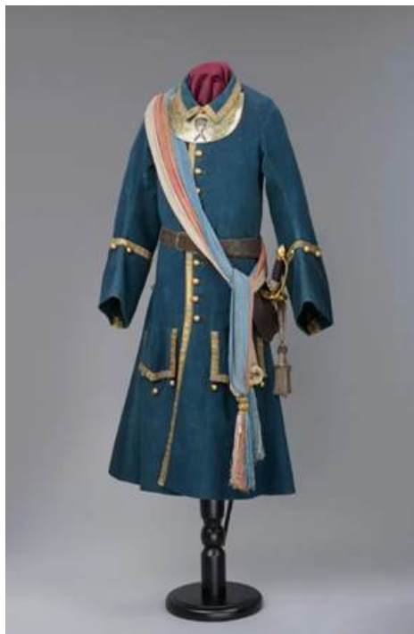
Рис. 11. Кафтан по форме полковника лейб-гвардии Преображенского полка.

позолоченными пуговицами (см. рис. 11). Его длина составляет 126,5 см.