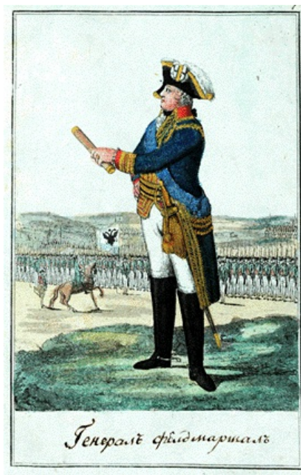
Рис. 9. Облик генерал-фельдмаршала.