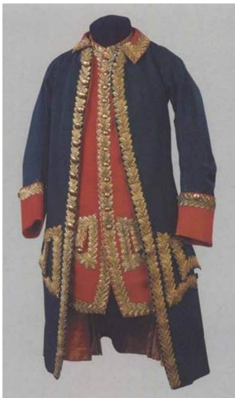
Рис. 14. Мундир генерал-майора от инфантерии образца 1764 года.

Близкими аналогами мундира А. М. Голицына являются костюмы генерал-майора (см. рис. 14) и генерал-поручика (см. рис. 15), относящиеся к концу XVIII в., что также позволяет выделить важные элементы, актуальные для нашей реконструкции. Длина костюма в этом случае типовая и составляет 102 см для кафтана, а для камзола – 79 см. Принадлежность второго костюма генерал-поручику подтверждает бирка со старинной надписью: «Вице-мундир генерал-поручика Ивана Алексеевича Потапова 1777 года» [57] .