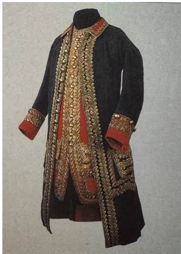
Рис. 15. Мундир генерал-поручика от инфантерии, 1764 г.

Следует отметить, что изготовление мундиров в начале XVIII века осуществлялось индивидуально, что приводило к заметным различиям в качестве исполнения даже в пределах одного полка. Офицерам выдавалось сукно для самостоятельного пошива, а окраска материалов производилась различными красильными артелями, что создавало вариативность в оттенках. Только к XIX веку появились специализированные артели для пошива военной формы, что привело к большей унификации внешнего вида.