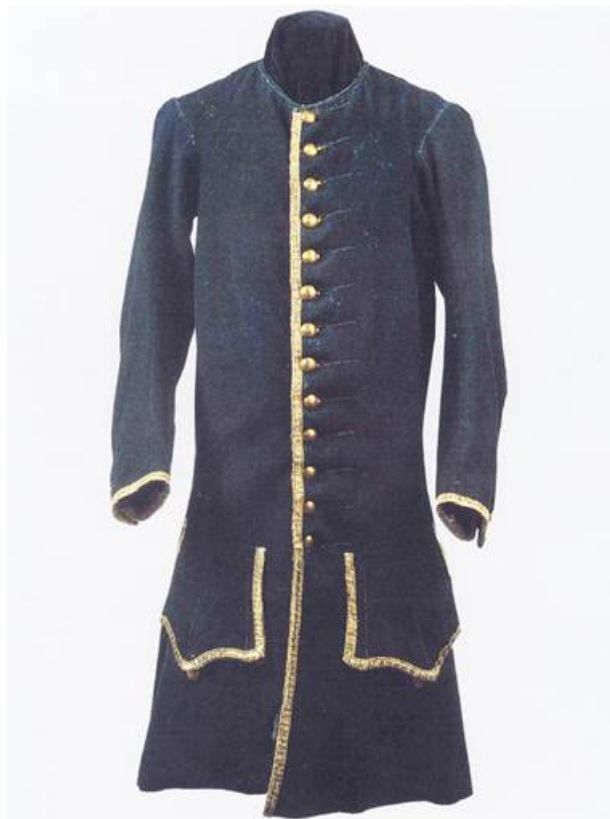
Рис. 12. Камзол из гвардейского офицерского комплекта Петра. 1720 г.

Инв. № 12/1605