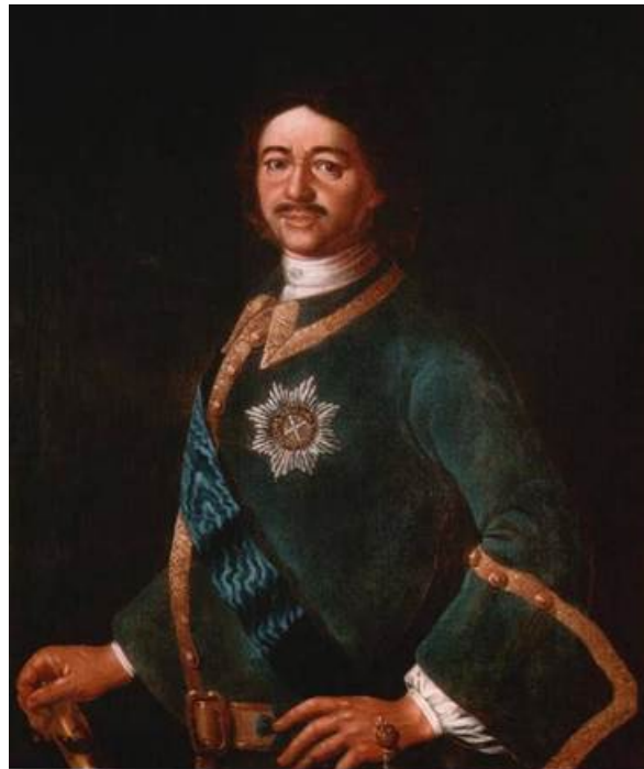
Рис. 6. Портрет Луи Каравака «Пётр I», 1720 г.

При анализе изобразительных источников было отмечено некоторое сходство парадного мундира М. М. Голицына, представленного на указанном выше портрете, с мундиром на портрете Петра I авторства Луи Каравака (см. рис. 6). На нём государь изображён в мундире Преображенского полка с лентой и звездой ордена Святого Андрея Первозванного. Портрет позволяет сделать выводы о цвете, обрамлении и крое мундира, в частности, о строении рукавов.