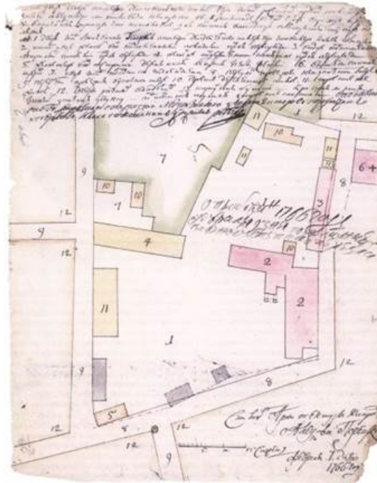
Рис. 2. План двора князя А. М. Голицына.

мог не уделять внимания своим многочисленным вотчинам, в том числе палатам, унаследованным от отца. О том, как выглядела усадьба во второй половине XVIII в., можно составить представление по сохранившемуся плану владений, датируемому 1766 г. [33, 34]. На нём отмечены: двор тогдашнего владельца, генерал-аншефа А. М. Голицына, с каменными палатами, людскими, деревянной конюшней и жилыми и нежилыми постройками; церковь Святой Троицы в Хохлах; соседний двор и сад полковника Ислентьева; проезжие переулки; дворы разных владельцев и караульная будка (см. рис. 2).