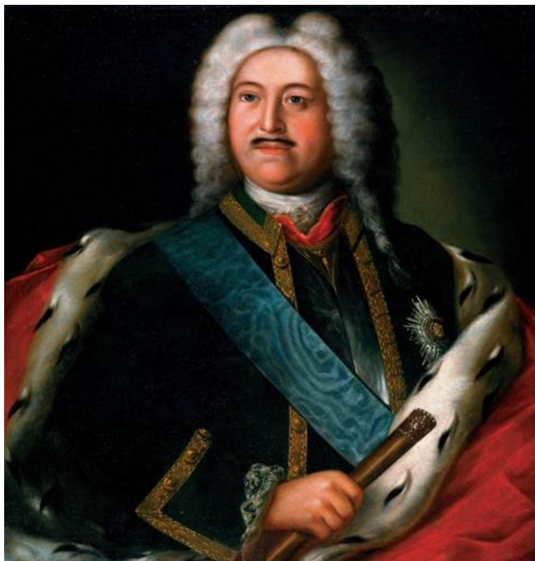
Рис. 4. Портрет М. М. Голицына. Неизвестный художник по оригиналу начала XVIII в. Датируется XIX в.