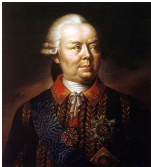
Рис. 7. Портрет генерал-фельдмаршала П. А. Румянцева-Задунайского. Неизвестный художник. 1770-е гг.