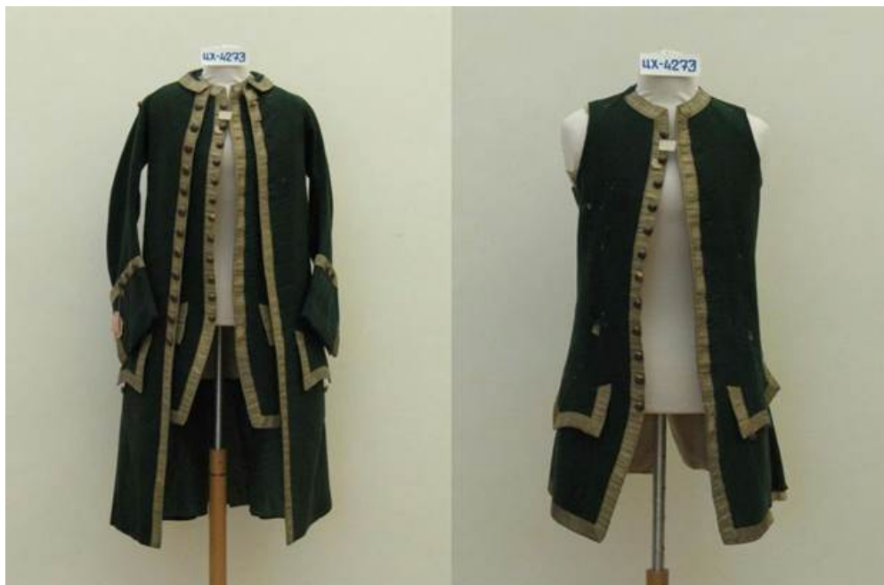
Рис. 13. Мундир офицера лейб-гвардии Семёновского полка. 1761 - 1762 гг.

Источник: коллекции Государственного художественно-архитектурного дворцово-паркового музея-заповедника «Павловск». Инв. № ЦХ-4273-II