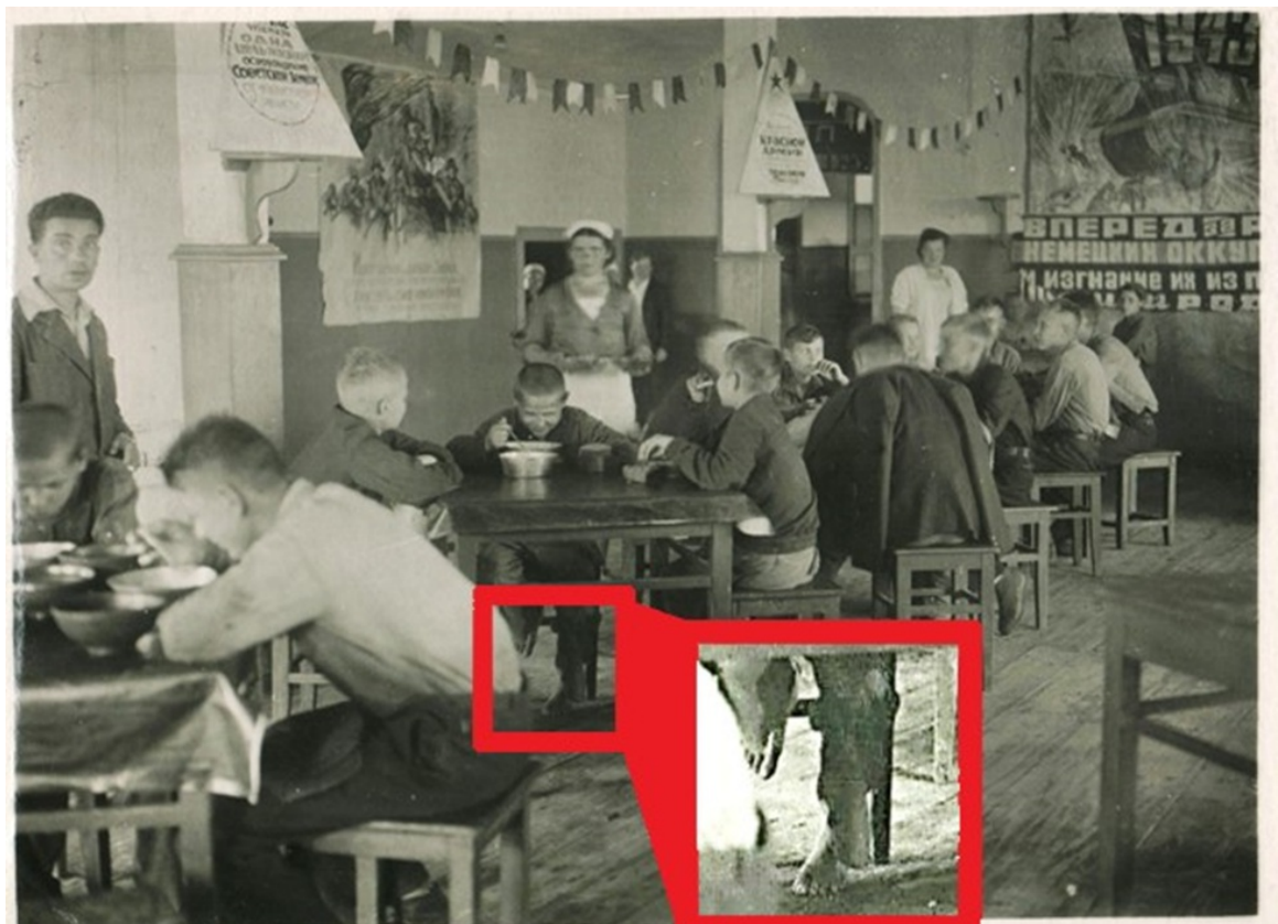
Рис. 4. Столовая ремесленного училища № 25 (увеличена часть кадра с босоногим учеником).