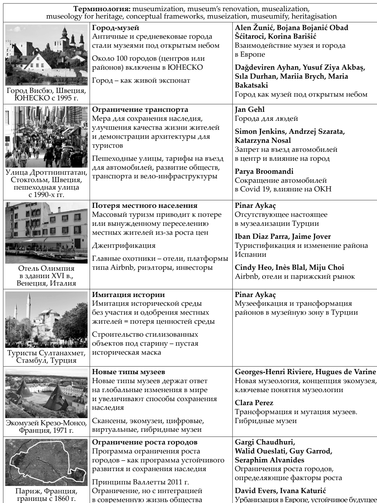
Таблица 2. Особенности музеефикации Европы (Франция, Италия, Турция, Швеция) Table 2. Features of museumification in Europe (France, Spain, Italy, Turkey, Sweden)