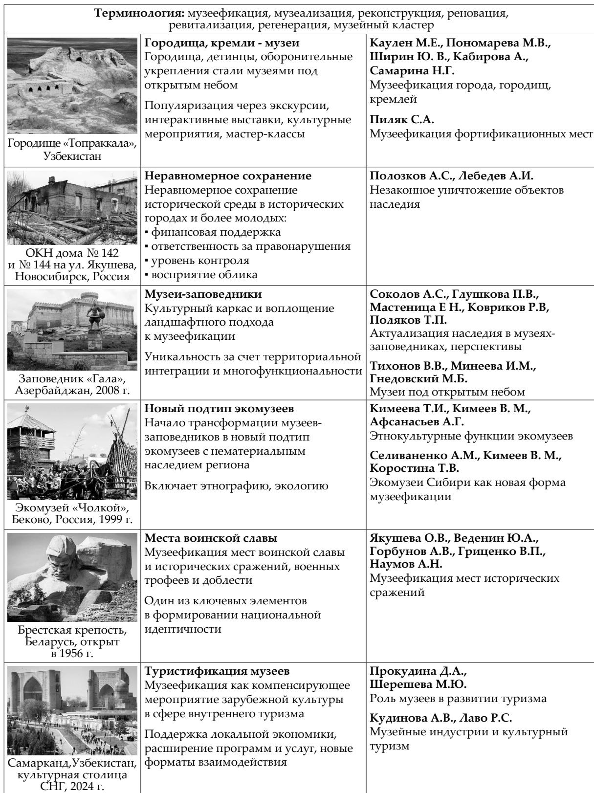
Таблица 3. Особенности музеефикации СНГ (Россия, Беларусь, Азербайджан, Узбекистан) Table 3. Features of museumification in the CIS (Russia, Belarus, Azerbaijan, Uzbekistan)