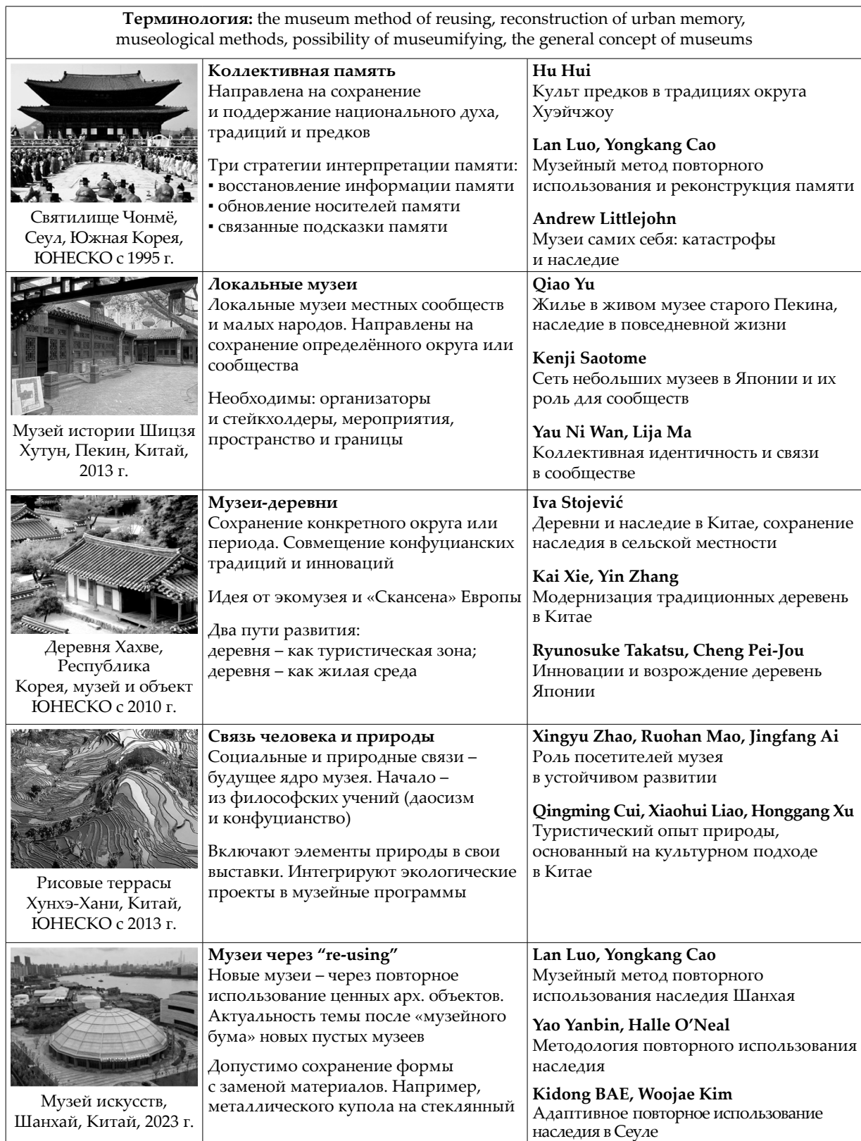
Таблица 1. Особенности музеефикации Восточной Азии (Китай, Япония, Южная Корея) Table 1. Features of museumification in East Asia (China, Japan, South Korea)