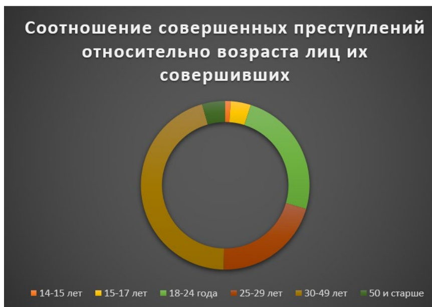
Рис. 3. Соотношение совершенных преступлений относительно возраста лиц их совершивших.

Статистические показатели МВД РФ позволяют сформировать следующее соотношение лиц, совершивших мошенничество в сфере IT-технологий, опираясь на их возрастную цензу (рис. 3).