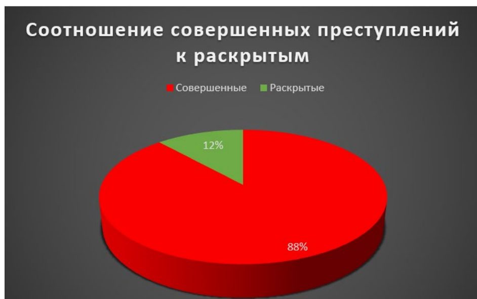
Рис. 1. Соотношение совершенных преступлений к раскрытым.

января по сентябрь 2022 года, общее число мошенничеств, совершенных с применением информационно-телекоммуникационных технологий составило 178168 из них, раскрыто всего 23556 преступлений. На рис. 1, мы можем рассмотреть соотношений совершенных и раскрытых преступлений данного рода.