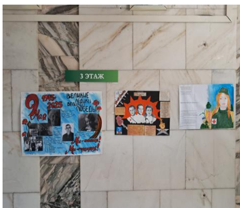
Рис. 2. Стенгазеты.

Fig. 1. Presentations about the heroes of the Great Patriotic War.