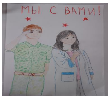
Рис. 4. Стенгазета. Fig. 4. Wall newspaper.

Одним из педагогических условий, способствующих эффективному воспитанию основ гражданской идентичности, патриотизма у студентов на занятиях по иностранному языку, является содержание учебного материала. Оно должно быть подобрано так, чтобы сделать возможным решение как учебных так и воспитательных задач в ходе аудиторной и внеаудиторной работы по предмету. Материалы могут быть представлены в виде учебных и аутентичных текстов, а также различных заданий и упражнений.