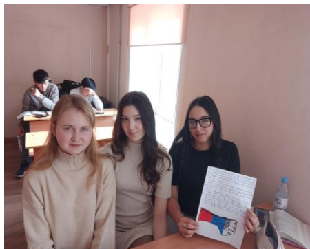
Рис. 3. Акция «Письмо солдату». Fig. 3. Action "Letter to a soldier".