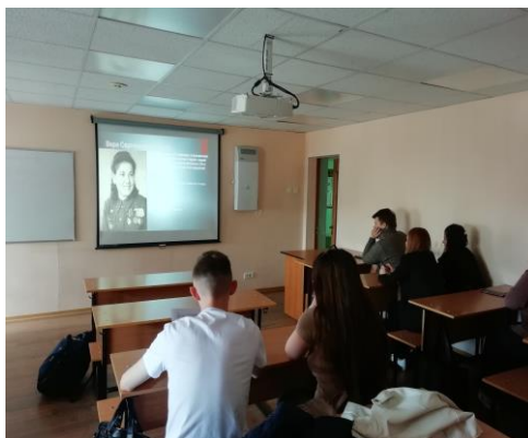
Рис. 1. Презентации о героях ВОВ.

«Георгиевская ленточка». Ко дню Победы студенты готовят стенгазеты и презентации «Защитникам Родины посвящается» (рис. 1, 2), в которых рассказывают о медиках из Алтайского края, принимавших участие в Великой Отечественной войне, их боевых заслугах и подвигах.