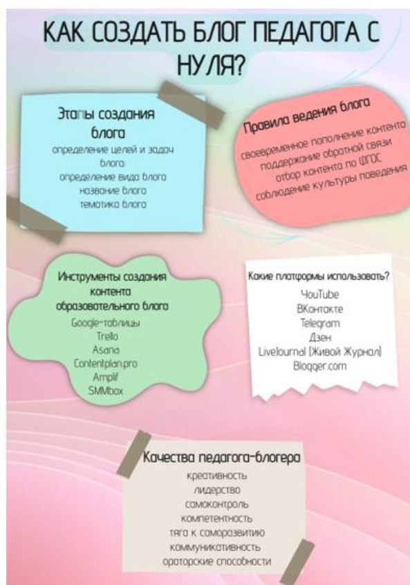
Рис. 2. Чек-лист для педагогов «Как создать блог педагога с нуля». Fig. 2. Checklist for teachers «How to create a teacher's blog from scratch».

Обучающимся и педагогам было предложено пройти повторное исследование с применением описанных выше трех диагностических методик. Проанализировав полученные данные повторной