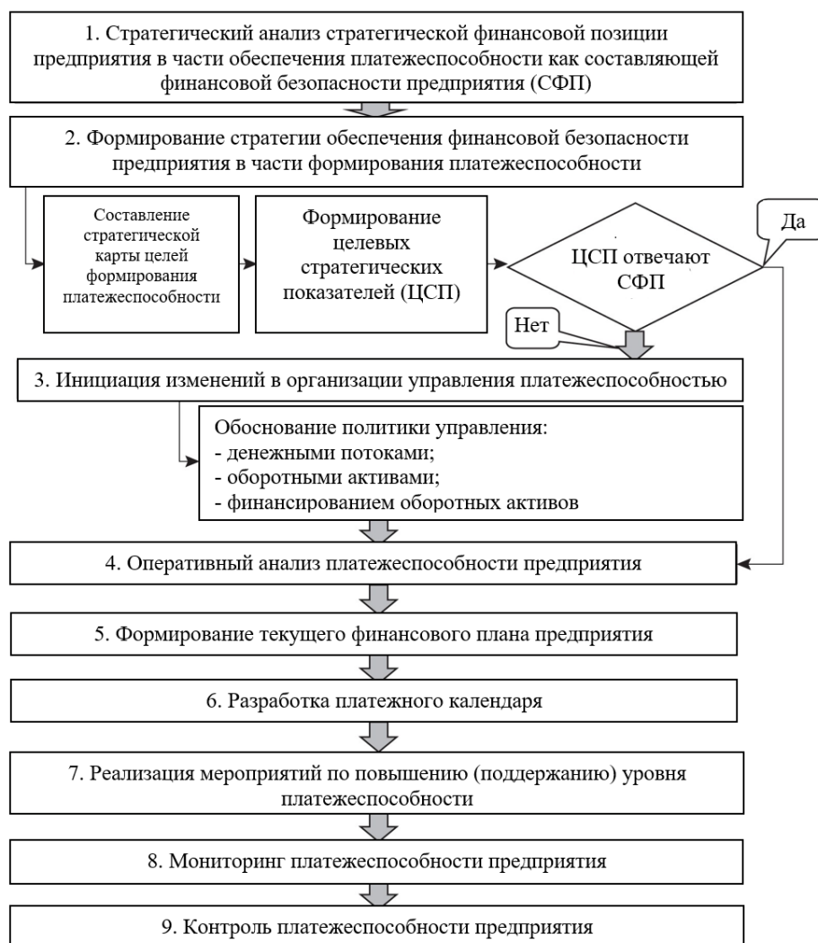
Рис. 4. Этапы процесса управления платежеспособностью в целях обеспечения экономической безопасности организации.

Fig. 4. Stages of the solvency management process in order to ensure the economic security of the organization.