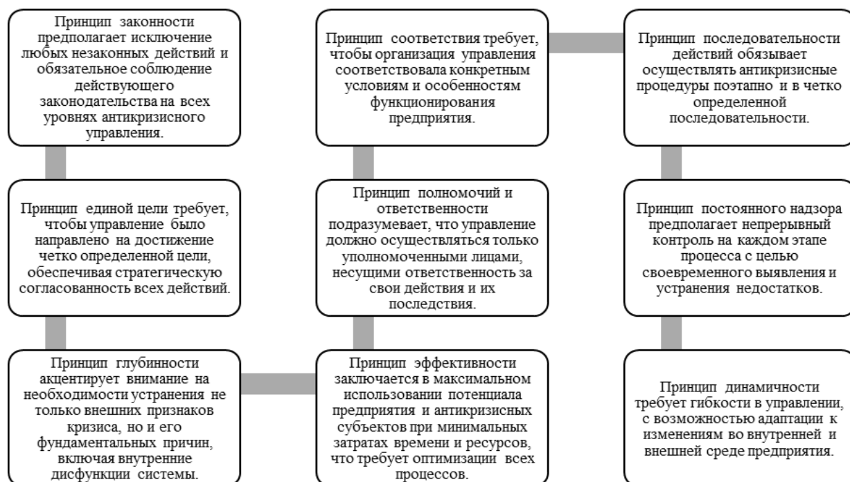
Рис. 3. Принципы управления платежеспособностью в целях обеспечения экономической безопасности организации.

нований, которые детерминируют вектор организационного поведения, в том числе в условиях кризисных вызовов, когда осуществляется не только нормализация функциональных и операционных процессов управления, но и прямая оптимизация внутренних мета-процессов финансовой и операционной деятельности с целью восстановления и закрепления финансово-экономической стабильности в условиях макроэкономической нестабильности и рыночной неопределенности [13, с. 35]. К общим принципам управления следует отнести следующие (рис. 3):