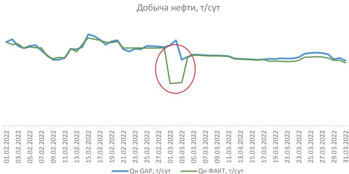
Рис. 3. Сравнение добычи нефти посуточно (GAP/ФАКТ) Fig. 3. Daily oil production comparison (GAP/FACT)