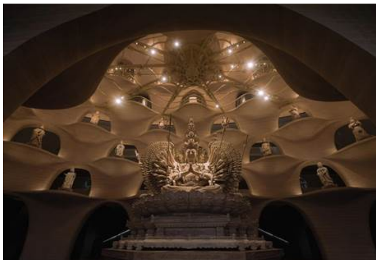
(Иллюстрация 4. Внутренний вид пагоды)

Вторая зона облачными узорами внутреннего пространства пагоды располагается в её верхней части и включает в себя две статуи Будды Гуаньинь, она занимает центральное положение на вершине тензорно-балочной конструкции, под которой расположен большой круглый лotosовый трон. Эти две статуи, изображающие Будду Гуаньинь, размещены спина к спине на лotosовом сиденье, символизирующем гору Сумеру, с использованием элементов декора, имитирующих «подсветку» [11] между ними. Разделённые конструкцией на основе струнных и балочных элементов. Архитектурные решения предусматривают использование стальных натяжных балок, украшенных орнаментами в виде лотоса и других декоративных элементов. В отличие от традиционных пагод, данная конструкция отличается применением современной балочной системы.