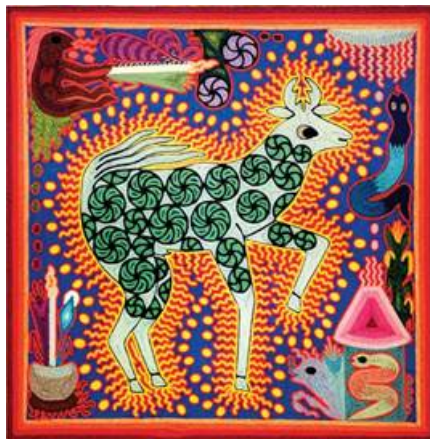
Рисунок 2. Индейцы уичоли, Мексика. Цветные всполохи огня окружают бога оленя Тамаци Каюумари. Визионерский опыт художника-шамана Сантоса Даниэля Каррильо Хименеса [6, с. 110]