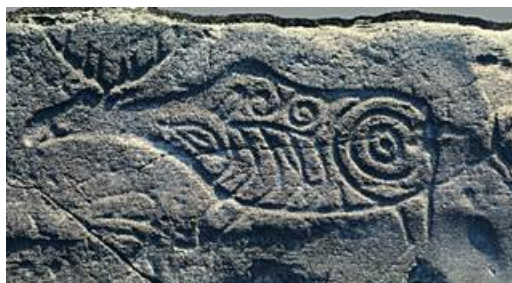
Рисунок 3. Сикачи-Алян, Хабаровский край. Богиня Лосиха или дух. Петроглиф выбит на базальте. Предполагаем, что подобный визионерский опыт стал источником этого петроглифа