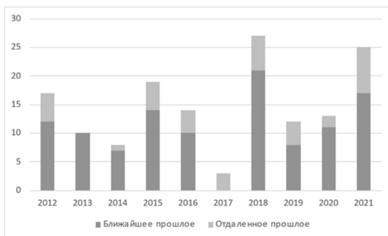
Рисунок 4. Динамика использования слов-маркеров ближайшего и отдаленного прошлого в официальном дискурсе президента РФ в 2012–2021 гг. (абсолютные показатели)

«Перед Россией стоят прорывные исторические задачи, и в их решении значим вклад каждого. Вместе, сообща мы обязательно изменим жизнь к лучшему» [18] .