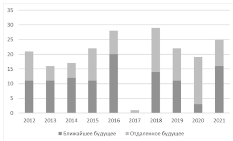
Рисунок 3. Динамика использования слов-маркеров ближайшего и отдаленного будущего в официальном дискурсе президента РФ в 2012–2021 гг. (абсолютные показатели)

«Судьба России, ее историческая перспектива зависит от того, сколько нас будет (...), сколько детей родится в российских семьях через год, через пять, десять лет, какими они вырастут, кем станут, что сделают для развития страны...» [17] .