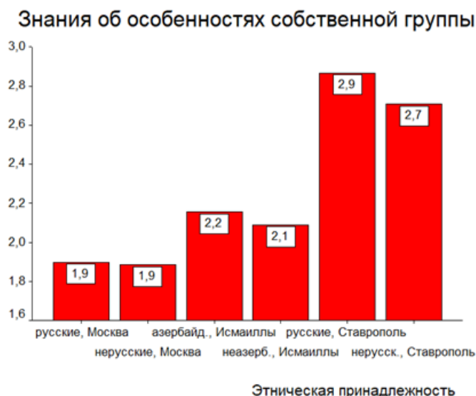
Рис. 1. Значимые различия в показателе когнитивного компонента «Знания об особенностях собственной группы» при групповом дисперсионном анализе структуры этнической идентичности личности

структурных компонентов этнической идентичности личности современных подростков. Между подростками, проживающими в одной культурной среде, значимых культурных различий в показателях структурных компонентах этнической идентичности личности не существует. Данные, которые отражают выявленные значимые различия в показателе когнитивного компонента этнической идентичности, мы представили в рисунке 1.