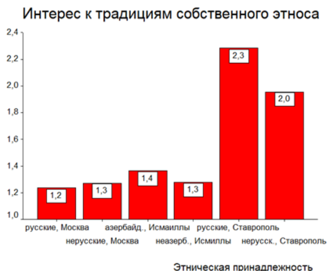
Рис.3. Значимые различия в показателе когнитивного компонента «Интерес к традициям собственного этноса» при групповом дисперсионном анализе структуры этнической идентичности личности

Согласно данным представленным в рисунке 3 мы видим, что показатель «Интерес к традициям собственного этноса» когнитивного компонента сильнее проявился в группе подростков из выборки, представляющий г. Ставрополь. Данный феномен мы объясняем тем, что г. Ставрополь, один из южных городов России, где сохранены понятие «большая традиционная родовая семья» и все представители семьи участвуют в семейных мероприятиях, в которых соблюдаются традиции, имеющие вековую историю. Таким образом мы можем сказать, что все показатели когнитивного компонента взаимосвязаны и высокий уровень показателя в одной группе, детерминирует высокий уровень развития других показателей, входящих в состав данного компонента этнической идентичности личности.