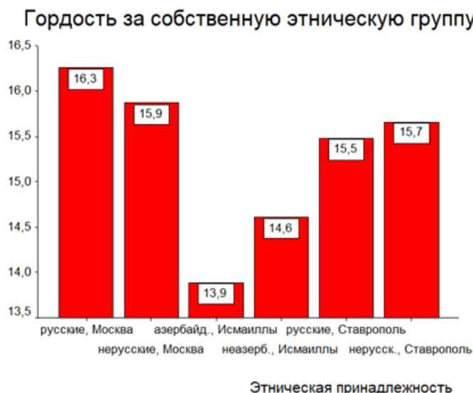
Рис. 5. Значимые различия в показателе аффективного компонента «Гордость за собственную этническую группу» при групповом дисперсионном анализе структуры этнической идентичности личности.