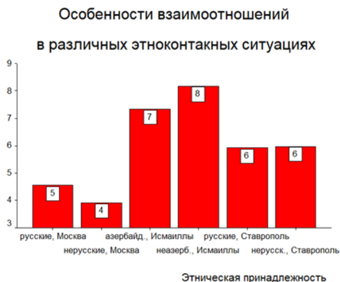
Рис. 6. Значимые различия в показателе поведенческого компонента «Особенности взаимоотношений в различных этно-контактных ситуациях» при групповом дисперсионном анализе структуры этнической идентичности личности.

Согласно результатам, представленным в рисунке 6, данный показатель на высоком уровне проявился у подростков азербайджанской этнической группы и у подростков, не идентифицирующих себя с азербайджанской этничностью из г. Исмаиллы (Азербайджан). Этот феномен мы можем объяснить проживанием подростков из Азербайджана вне различия к какой этнической группе они себя относят, в условиях межэтнического конфликта. В процессе межэтнического конфликта личность наиболее ярко проявляет свои этническую идентичность, обостренно реагирует на межэтнический контакт. При сравнении мы видим, что на одинаковом уровне проявлен данный показатель поведенческого конфликта у подростков из г. Ставрополя русской этничности и не идентифицирующих себя с русской этнической группой. Этот феномен мы объясняем тем, что подростки из г. Ставрополя, вне зависимости от своей этнической группы так же проживают в больших семьях, сохраняют тесную меж поколенную связь и передают манеры поведения через поколения, обучают вести себя как настоящий русский, армянин, осетин, и т.д. Ниже всех проявился этот показатель у подростков из московской культурной среды как русской этнической группы, так и у подростков, не идентифицирующих себя с русской этничностью.