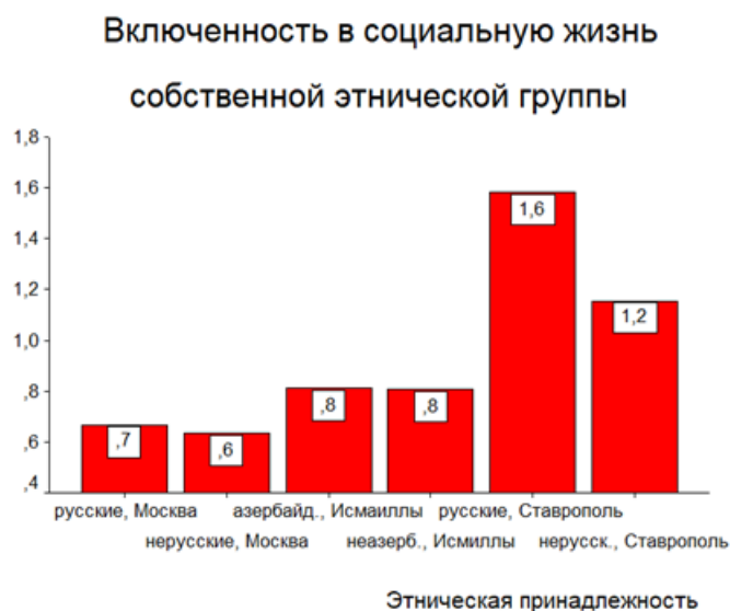
Рис. 2. Значимые различия в показателе когнитивного компонента «Включенность в социальную жизнь собственной этнической группы» при групповом дисперсионном анализе структуры этнической идентичности личности.

Согласно представленным данным в рисунке 2, показатель когнитивного компонента «Включенность в социальную жизнь собственной этнической группы» так же продемонстрировал значимые различия между группами. По этому показателю самый высокий уровень у подростков из русской этнической группы из г. Ставрополь и немного ниже у подростков из группы, не идентифицирующих себя с русской этнической группой из г. Ставрополь. Подростки из г. Исмаиллы, идентифицирующие себя как азербайджанцы и не идентифицирующие себя, как азербайджанцы, продемонстрировали высокий уровень показателя «Включенность в социальную жизнь собственной этнической группы», по сравнению с московскими подростками, идентифицирующими себя с русской этнической группой и с подростками, не идентифицирующими себя с русской этнической группой. Эти данные мы можем объяснить, что подросток из г. Исмаиллы гораздо больше включен в культурную составляющую общественной жизни своей этнической группы. Он становится участником социальной жизни, где выполняются те или иные традиционные ритуалы, сопровождающие как счастливые, так и грустные моменты жизни своей этнической группы. Происходит восприятие культурных особенностей своего этноса, интериоризация культурных процессов собственной этнической группы, которая стимулирует третий показатель когнитивного компонента «Интереса к традициям собственного этноса».