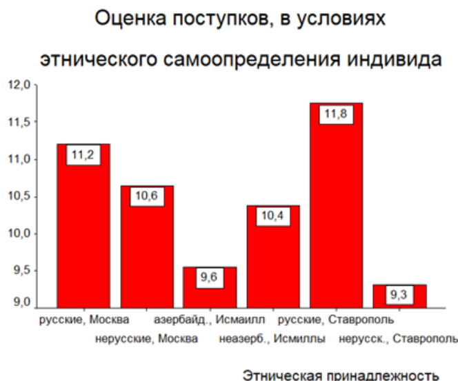
Рис. 7. Значимые различия в показателе поведенческого компонента «Оценка поступков, в условиях этнического самоопределения индивида» при групповом дисперсионном анализе структуры этнической идентичности личности.

Согласно результатам, представленным в рисунке 7 показатель поведенческого компонента «Оценка поступков, в условиях этнического самоопределения индивида» доминирует у подростков из русской этнической группы из г. Ставрополя и русской этнической группы из г. Москвы. Так как в обоих случаях речь идет о представителях титульного народа, доминирование данного показателя является само собой разумеющимся следствием. Подростки, которые принадлежат к этническому большинству, в условиях этнического многообразия более демонстративно показывают свою избранность, свою причастность к доминирующей этнической группе. В свою очередь мы видим, что у подростков азербайджанской этнической группы из г. Исмаиллы (Азербайджан) показатель «Оценка поступков, в условиях этнического самоопределения индивида» поведенческого компонента не сильно выражен, в отличие от подростков других этнических групп, которые принимали участие в выборке. Данный феномен мы объясняем переживанием утраты своей территориальной целостности своим этносом каждого подростка, и переносом этой трагедии на себя, на свою личность. В случае существования экзистенциональной угрозы подросток не старается сильно выпячивать свою этническую составляющую, что может в дальнейшем способствовать формированию отрицательного отношения к собственной этнической принадлежности.