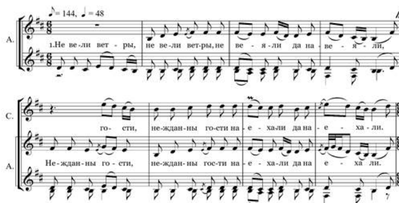
Рисунок 1. Фрагмент свадебной песни «Не вели ветры»

Приведем пример анализа фрагмента свадебной песни «Не вели ветры» [13, с. 55], записанной в Архангельской области от фольклорной группы Государственного Северного русского народного хора, запись и нотация В. Попикова [13, с. 120] (рис.1)