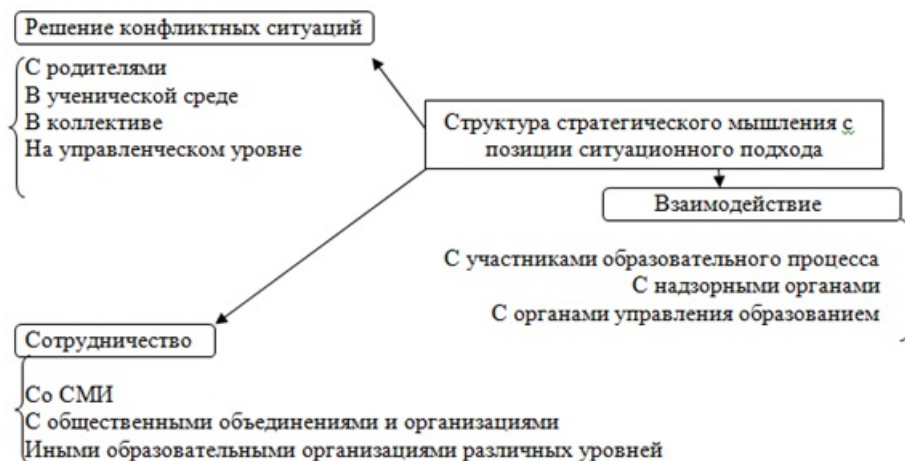
Рис. 2. Структура стратегического мышления с позиции ситуационного подхода

Структура стратегического мышления с позиции ситуационного подхода может быть представлена следующим образом (рис. 2) [9, с. 496] .