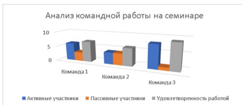
Рис.1. Анализ командной работы 2 курса по теме «Посольство Н. Спафария в Китай».

Такой объемный блок задач реализуется за счет того, что на первом курсе студенты уже отработывали многие приемы работы с текстами, знакомы с особенностями изучения разных по жанру документов, имеют навыки командной работы и т.п. Кроме того, обучающиеся имеют возможность опереться на полученные ими знания из других дисциплин, что повышает степень и качество обработки полученной информации. Данные студенческой рефлексии о подобных занятиях позволяют утверждать, что эмоциональная удовлетворенность собственной работой и полученной оценкой довольно высокая (Рис.1). На занятии присутствовало 26 человек, работавших в трех командах по 9, 8 и 9 человек, соответственно. По итогам занятия студенты ответили на вопрос об эмоциональном состоянии, количество активно работавших и пассивно вовлеченных на занятии преподаватель отметил самостоятельно.