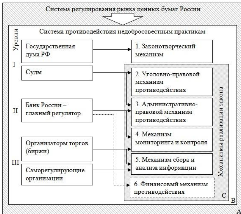
Рис. 2. Механизмы, составляющие систему противодействия недобросовестным практикам на рынке ценных бумаг России

Как видно из рисунка 2, система противодействия недобросовестным практикам состоит из следующих механизмов: