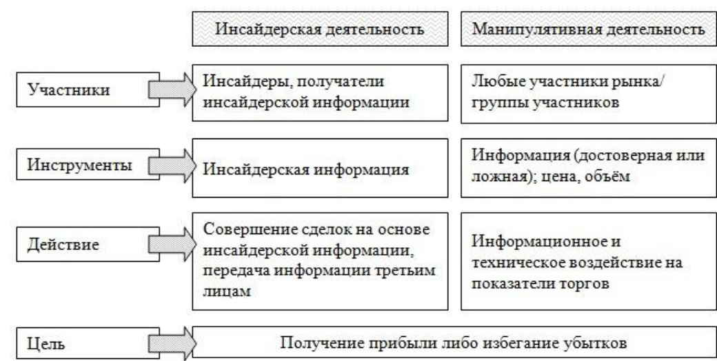
Рис. 1. Признаки инсайдерской и манипулятивной деятельности

Инсайдерская и манипулятивная деятельность часто бывают взаимосвязаны. Инсайдерская информация может быть инструментом манипулирования рынком. Рассмотрим подробнее признаки инсайдерской и манипулятивной деятельности (рис.1).