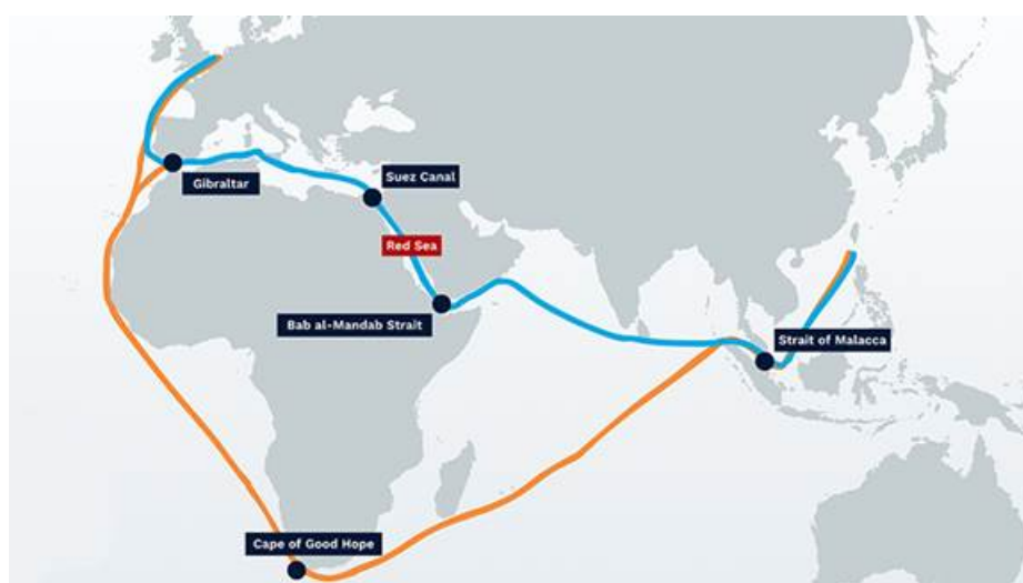
Рисунок 3. Суэцкий и Африканский морские маршруты из Азии в Европу.

Из вышеприведенной таблицы первые 4 компании полностью прекратили транзит, а китайская «COSCO» заявила о том, что прекращает прием заказов и отправку грузов в Израиль [35] , тем самым фактически выполнила требование Хуситов о морской блокаде Израиля. После принятия решений о перенаправлении судов, они были отправлены в обход проблемного региона – по альтернативному пути через Мыс Доброй Надежды, огибая весь Африканский континент (см. рисунок 3). Отметим, что морской путь из Азии в Европу через Суэцкий канал является основным маршрутом поставки товаров (по разным оценкам от 7% до 12% всей морской торговли проходит именно по нему, включая 30% контейнерных перевозок) из этих регионов.