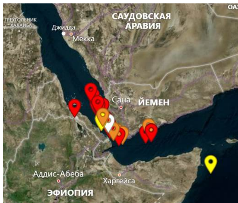
Рисунок 2. Концентрация инцидентов с морскими судами около побережья Йемена.

С начала нового витка арабо-израильского конфликта в октябре 2023 года Хуситы стали представлять серьезную угрозу в акватории южной части красного моря, а также в Баб-эль-Мандебском проливе. После захвата Израильского автобуса «Galaxy Leader» 19 ноября количество опасных инцидентов с морскими судами в южной части акватории красного моря и Баб-эль-мандебском проливе значительно возросло. В основном, все инциденты и подозрительные происшествия сконцентрированы как раз около побережья Йемена (см. рисунок 2), что свидетельствует об активной деятельности Хуситов по блокировке не только Израильского морского судоходства, но и других стран, связанных с Израилем или не связанных вовсе.