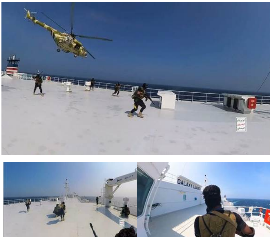
Рисунок 1. Вооруженный захват Хуситами автомобилевоза «Galaxy Leader».