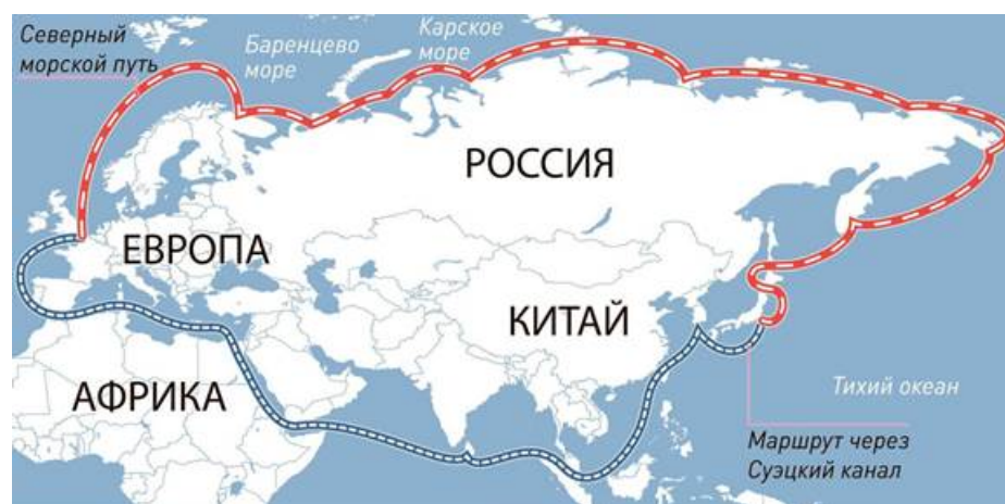
Рисунок 4. Маршрут Северного морского пути.

И здесь стоит отметить, что Россия обладает возможностью развития альтернативного морского пути из европейской части в Азию – это северный морской путь (см. рисунок 4).