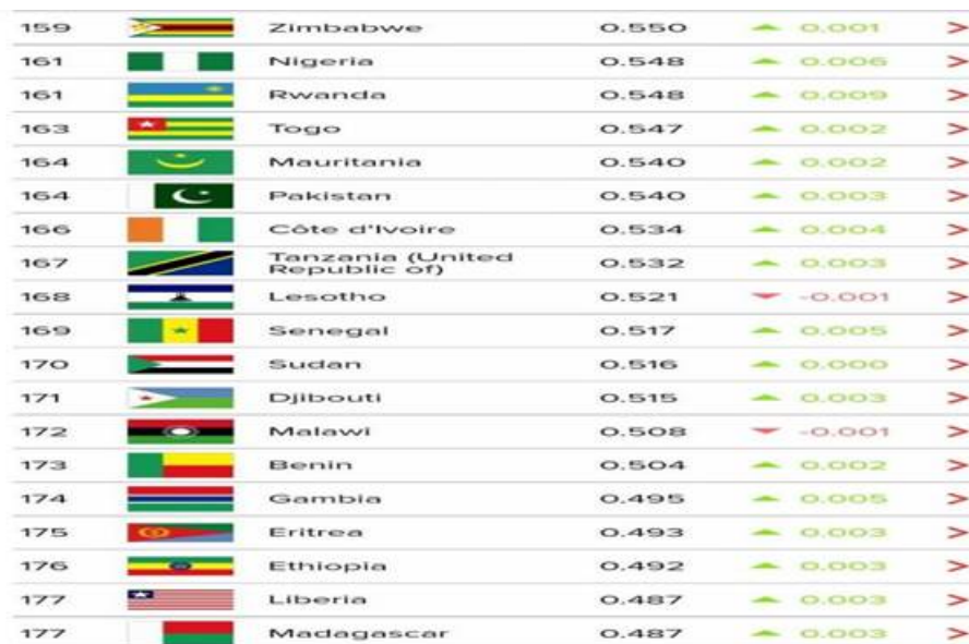
Рисунок 4: Анализ человеческого развития 2023/2024 гг. [15].

Официальная помощь в целях развития (ОПР) — это государственная поддержка, направленная на улучшение благосостояния и экономического роста слаборазвитых стран. Она не включает кредиты и займы, используемые на военные цели.