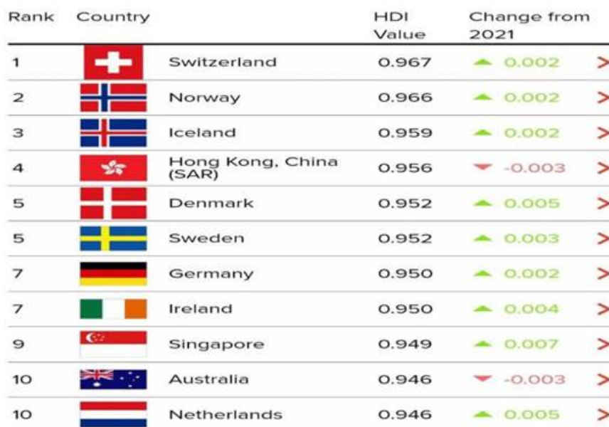
Рисунок 3: 10 главных идей развития человеческого потенциала за 2023/2024 гг. Получено с сайта: https://hdr.undp.org/data-center/country-insights#/ranks [14].