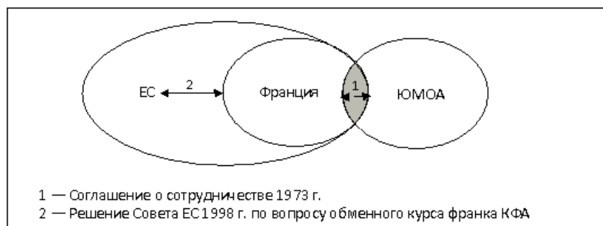
Рис. 3. Зона франка КФА в постбиполярную эпоху