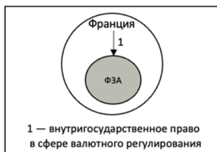
Рис. 1. Зона франка КФА в колониальный период

Следовательно, в колониальный период валютные зоны (французского франка, с 1945 г. — франка КФА) представляли институт, регулируемый национальным законодательством Франции, с целью установления особого валютного режима между метрополией, с одной стороны, и колониями, с другой стороны (рис. 1).