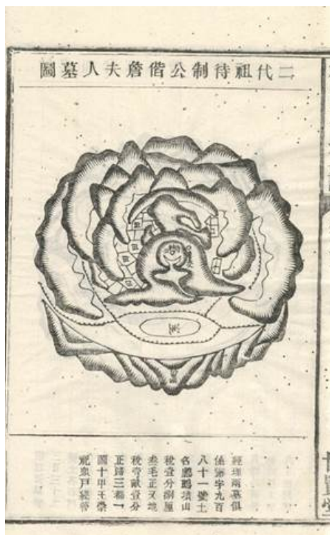
Рисунок 1. Карта гробницы второго предка Дайчжи и госпожи Чжань. Изображение из «Генеалогии рода Ван из Хуайси», том 6 («Гробница второго поколения рода Ван и его супруги»), 1856 г. Шанхайская библиотека, №939348.

из «Ответвления родословной семьи Ван из Хуайси» [25] (Рис. 1).