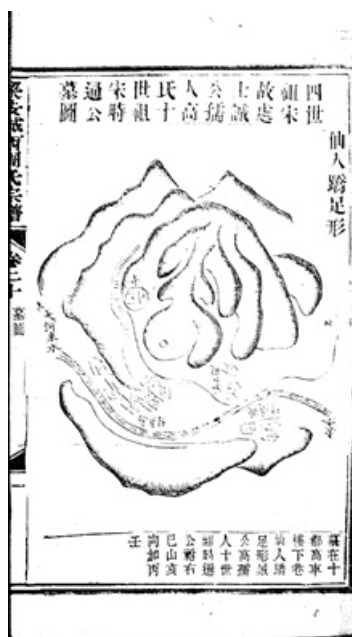
Рисунок 6. Карта кладбища господина Чэн и его супруги из рода Гао, предка четвертого поколения Сун, а также Ши Туна, предка десятого поколения эпохи Сун. Изображение из «Генеалогии семьи Чжоу из западной части города Цзеси», том 20 («Гробницы прадеда