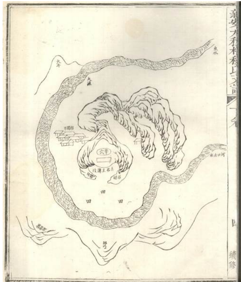
Рисунок 7. Схема гробницы шестого поколения предков рода Чэн. Гравюра из «Генеалогии ветви клана Чэн деревни Синьянь Дачэн, Карта гробницы шестого предка», эпоха Цин, 1740 г. [35]. Шанхайская библиотека, №911071-72. Источник изображения: цифровая копия, Аньхойский университет.

Даже те генеалогические книги, где не использовались свитки для могильных схем, акцентировали внимание на соответствии захоронений ценностям фэншуй – выделяя очертания гор и рек. Яркий пример – упомянутое ранее изображение могил рода Чэн из деревни Дачэн (Рис. 7).