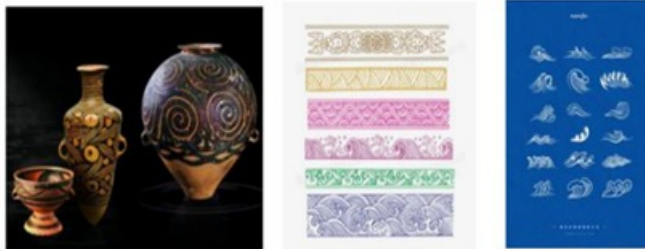
Рис. 6 Разные виды узоров водной волны в китайской культуре

богатство и процветание [11, С. 122] . Таким образом, являясь важным элементом в мире дизайна, геометрический узор с его простотой, порядком и напряженностью преодолевает границы времени и культуры и стал универсальным визуальным языком. Эти геометрические узоры не только обогащают выразительность дизайна, но и глубоко отражают человеческое понимание и стремление к красоте, что является важной частью дизайна.