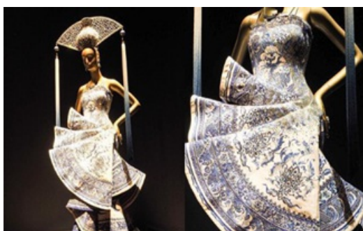
Рис. 10 Дизайн с морской водой и утесом реки

Таким образом, традиционные китайские узоры в дизайне – важная часть китайской традиционной культуры, они не только декоративны, но и несут в себе богатый культурный подтекст и символизм. Использование этих узоров в китайской современной вестиментарной моде очень популярно. Китайские дизайнеры введут инновацию в эти традиционные китайские узоры и сочетают их с современной модой, создавая новый стиль одежды – китайский стиль. Этот шаг не только сохраняет и продвигает китайскую культуру, но и способствует культурному обмену. Это также является воплощением глобализации культуры.