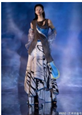
Рис. 7 Дизайн с новой формой узора водной волны

В современном дизайне одежды геометрические узоры стали волшебной палочкой в руках дизайнеров с их универсальными стилями и безграничным творческим потенциалом, дающим новую жизнь и смысл одежде. Например, В работе дизайнера Гао Цилинь форма узора водной волны сначала разбирается, разбивается на части в соответствии с определенными правилами и методами, а затем вновь собирается в новую форму узора водной волны (Рис. 7) [13] .