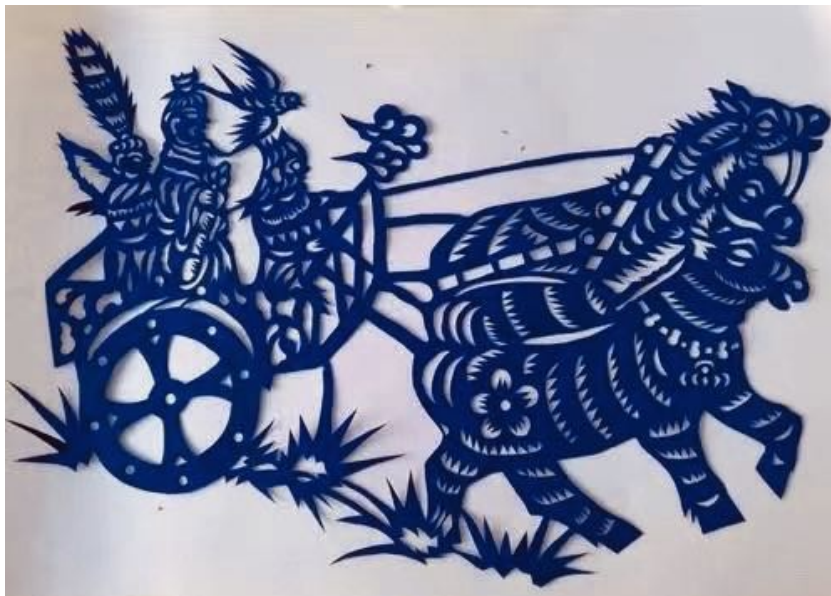
Рисунок 1. —Лань Фумэй «Святой воин Сунь У» (кит. «兵圣孙武» bingshengSunWu), 2007, г. Биньчжоу, провинция Шаньдун, собрание библиотеки Биньчжоу.

Сюжеты цзяньчжи Лань Фумэя разнообразны, это исторические личности, народные праздники, драматические сюжеты, цветы, птицы, рыбы, насекомые, домашняя птица и т. д. Одной из самых представительных работ Лань Фумэя является картина на исторический сюжет «Святой воин Сунь У», она была создана в 2007 г. (рисунок 1-2). Сунь У был уроженцем государства Ци (ок. 545 г. до н. э. - 470 г. до н. э.), был известным военным стратегом и государственным деятелем в период Весны и Осени Китая, почитался как святой воин.