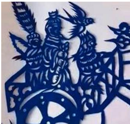
(кит. «兵圣孙武» bingshengSunWu), 2007, г. Биньчжоу, провинция Шаньдун, собрание библиотеки Биньчжоу. (фрагмент)